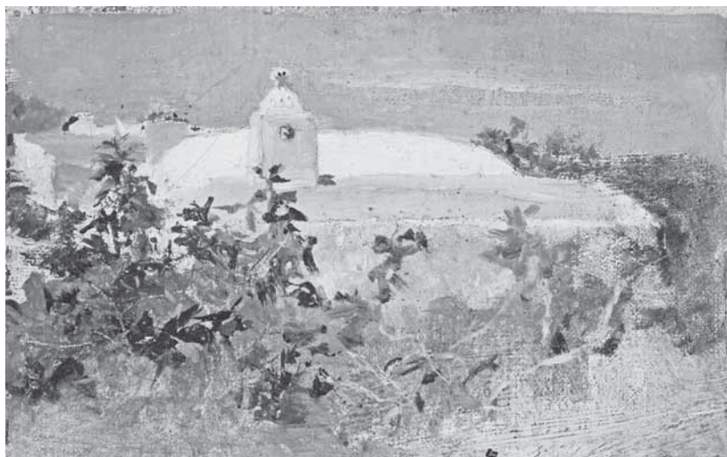
N. Mašić, Kuća na Capriju , 1880.