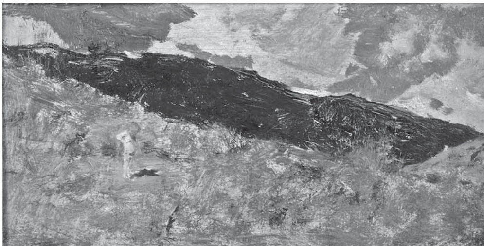
M. J. M. Fortuny y Marsal, studija M. J. M. Fortuny y Marsal, study

mahom malenih studija), ali i nepretencioznosti prikaza života puka (kojima će se vratiti nakon povratka iz Italije, uglavnom na način umrtvljenog akademizma). Njegova je Italija bila »postgeteovska« te »minhenska predimpresionistička Italija« te njegovo putovanje, kako se izrazio Peić, stoga nije bilo »historijsko«, već »biološko«. 48 Capri mu je pružio ono za čim je, prema Peiću, tragao u Posavini, »vidik samo od vode i neba«. 49 Kao temelj Mašićeva najboljeg dijela opusa stvaranog za ovih posavskih i talijanskih boravaka, Peić će više puta isticati stenografiju njegova crtačkog zapisa, Mašićev »biološki talijanizam« i »naslućeni japanizam«. 50