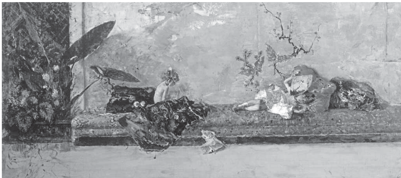
M. J. M. Fortuny y Marsal, I figli del pittore nel salone giapponese , 1874.