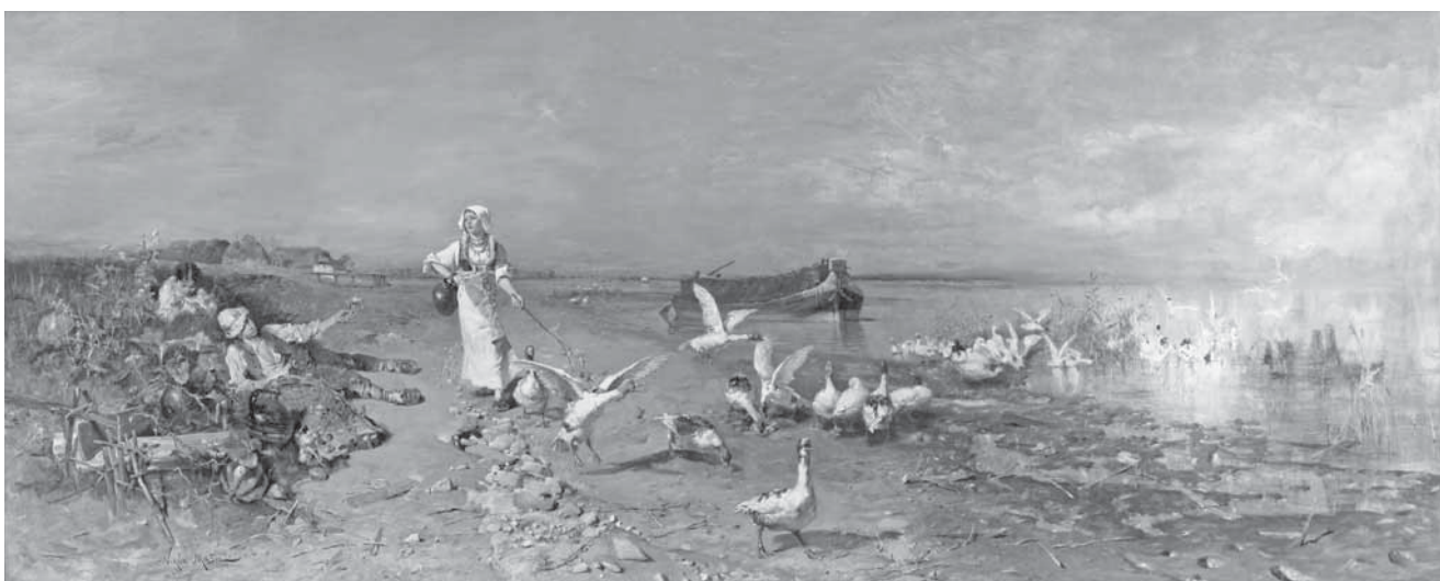
N. Mašić, Kokoši , 1881.

N. Mašić, Goose-Girl by the Sava River, 1880