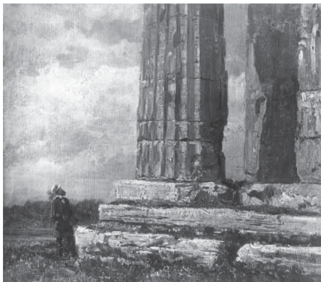
F. Palizzi, Rovine del tempio di Paestum

F. Palizzi, Rovine del tempio di Paestum