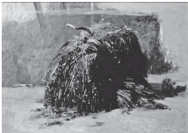
F. Palizzi, Fascio d'erba con falce , studija F. Palizzi, Fascio d'erba con falce , study

Cava (1881.), do njege su doprla preko brata Giuseppea, a posebno je uz Francusku bila vezana Scuola di Resina , koja je predstavljala i most između firentinskih Macchiaioli i napuljske tradicije pejzažizma, vedutizma i naturalizma, koja svoje modernije korijene u lokalnoj tradiciji nasljeđuje od posilipanske škole. Ne treba, stoga, čuditi da je upravo Napulj predstavljao točku u kojoj je Mašić mogao intuitivno pronaći naslućene odgovore na svoja osobna traženja. Pođemo li od socijalno-gospodarske krize, iscrpljenosti završenom revolucijom te dekadentnim ozračjem Mezzogiorna , možemo uočiti višestruke paralele s kriznom situacijom u Mašićevoj domovini, posebno u njezinu krajiškom dijelu, koji je njegov primarni zavičaj, opustošen previranjima, ratovanjima i traženjima. 29 Kada je o slikarstvu riječ, opisanu napuljsku situaciju na razmeđu akademizama i modernijeg poimanja slikarstva u smjeru plenerizma i mrljastog poteza, nije moguće definirati bez priznavanja difuznog prelijevanja granica i kontinuirane komunikacije svih protagonista, ma koliko se u prvi tren činili na oprečnim pozicijama, u potrazi koja je, u konačnici, zajednička. Uzmemo li u obzir različite tendencije unutar slikarstva europskog i posebice talijanskog ottocenta te činjenicu da su akademizam, akademski žanrovi i Akademija bili njegovo osnovno polazište, ne treba nas čuditi ni dihotomija između akademizma i težnje k modernijem