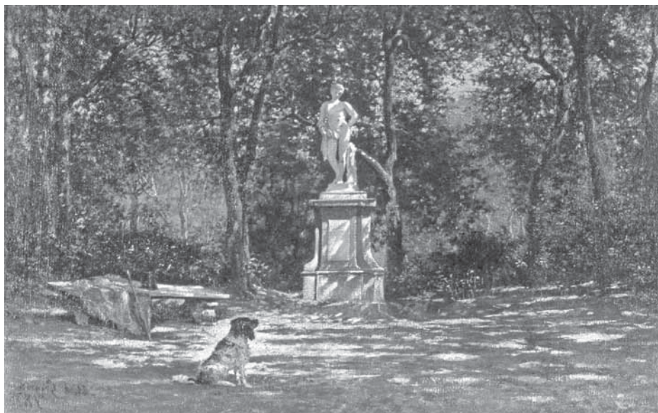
M. de Gregorio, Nel parco di Portici , 1876. (ljubaznošću Provincia di Napoli, Area Socioculturale, Direzione Politiche Culturali)