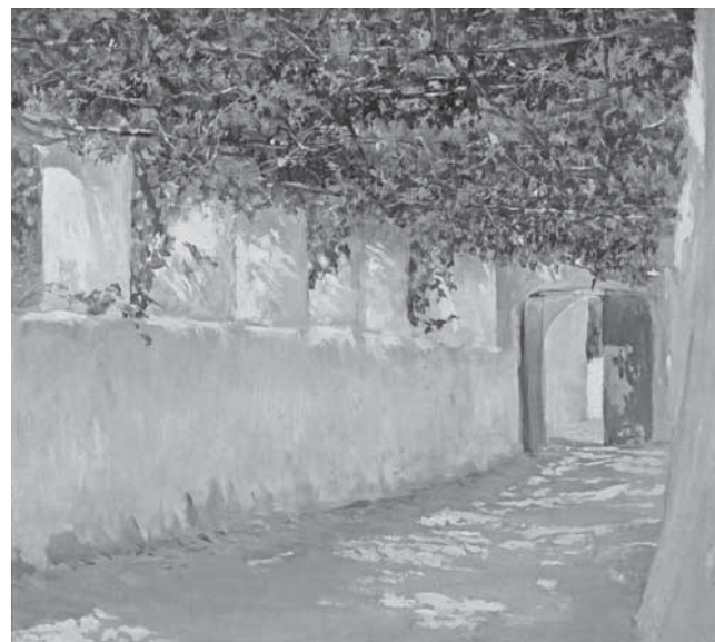
N. Mašić, Pergola II (Capri), 1880. N. Mašić, Pergola II (Capri), 1880