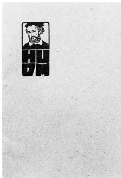
3 (a, b) Pravilnik Hrvatskog umjetničkog društva »Medulić« – Pečat s likom Andrije Medulića na naslovnici izradio je Tomislav Krizman. (Arhiv Konzervatorskog odjela u Splitu).

Ivan Meštrović, Andrija Medulić, plaster, 1909. The sculpture is in the National Museum in Belgrade.