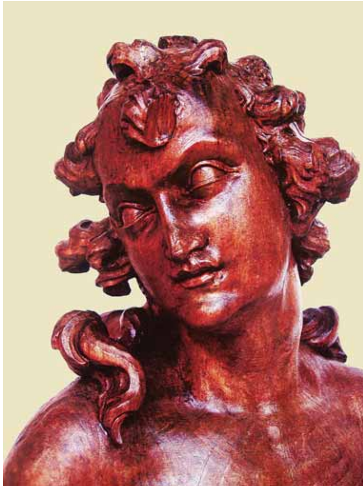
Giovanni Marchiori, Adonis , privatna zbirka, Italija Giovanni Marchiori, Adonis, Private collection, Italy

Rocco u Veneciji kao i kipovi pod pjevalištem crkve posvećene istom svecu. Riječ je o Davidu i Sv. Ceciliji , koje je kipar izradio 1741.–1743. godine. 18 Reljefe iz Scuola Grande di San Rocco publicirao je u bakropisu Giorgio Fossati već 1751., kao ilustracije uz Vita del gloriosso San Rocco . 19 U drugoj polovici četrdesetih godina 18. stoljeća nastaju brojna umjetnikova djela, poput oltara s kipovima Presvetog Trojstva s dva anđela u Oratoriju Pezzana u Carpenedu di Mestre, a krajem istog desetljeća i kipovi svetih Gervazija i Protazija na glavnom oltaru Župne crkve u Corbaneseu. 20 Godine 1750. kardinal Angelo Marija Querini naručuje mramornu grupu Uskrsli Krist pred Marijom Magdalenom za berlinsku Crkvu svete Hedvige, danas u Crkvi svete Marije u Berlinu. Godine 1753. skulptor izrađuje kip svetog Petra za glavni oltar venecijanske crkve Santa Maria della Pietà. 21 Marchiori 1756. postaje član mletačke Akademije, a krajem pedesetih seli svoju radionicu u Treviso. Uprkos tomu on i tijekom šezdesetih godina ostvaruje radove u Veneciji, poput kipova na fasadi Crkve svetog Roka. 22