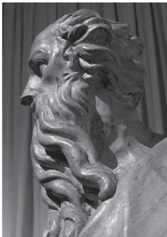
Giovanni Marchiori, Sveti Pavao , Stalna izložba crkvene umjetnosti, Zadar, detalj Giovanni Marchiori, St. Paul, Permanent Exhibition of Religious Art, Zadar, detail