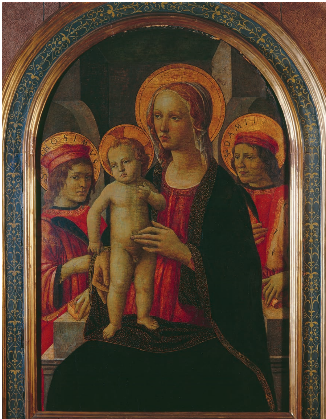
4. Firentinski slikar kraja 15. stoljeća, Bogorodica s Djetetom i svetima Kuzmom i Damjanom , tempera na dasci, 87 x 58 cm, inv. br. SG-48, Strossmayerova galerija starih majstora HAZU

Florentine painter from the late 15 th century, The Virgin with Child, St Cosmas, and St Damian, tempera on wood, 87 x 58 cm, inv. nr. SG-48, Strossmayer Gallery of Old Masters HAZU