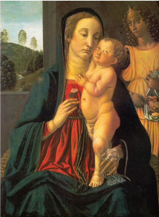
2. Cosimo Rosselli, Bogorodica s Djetetom i anđelom , tempera na dasci, 73,7 x 54,3 cm, Museum of Fine Arts, Boston Cosimo Rosselli, The Virgin with Child and an Angel , tempera on wood, 73.7 x 54.3 cm, Museum of Fine Arts, Boston