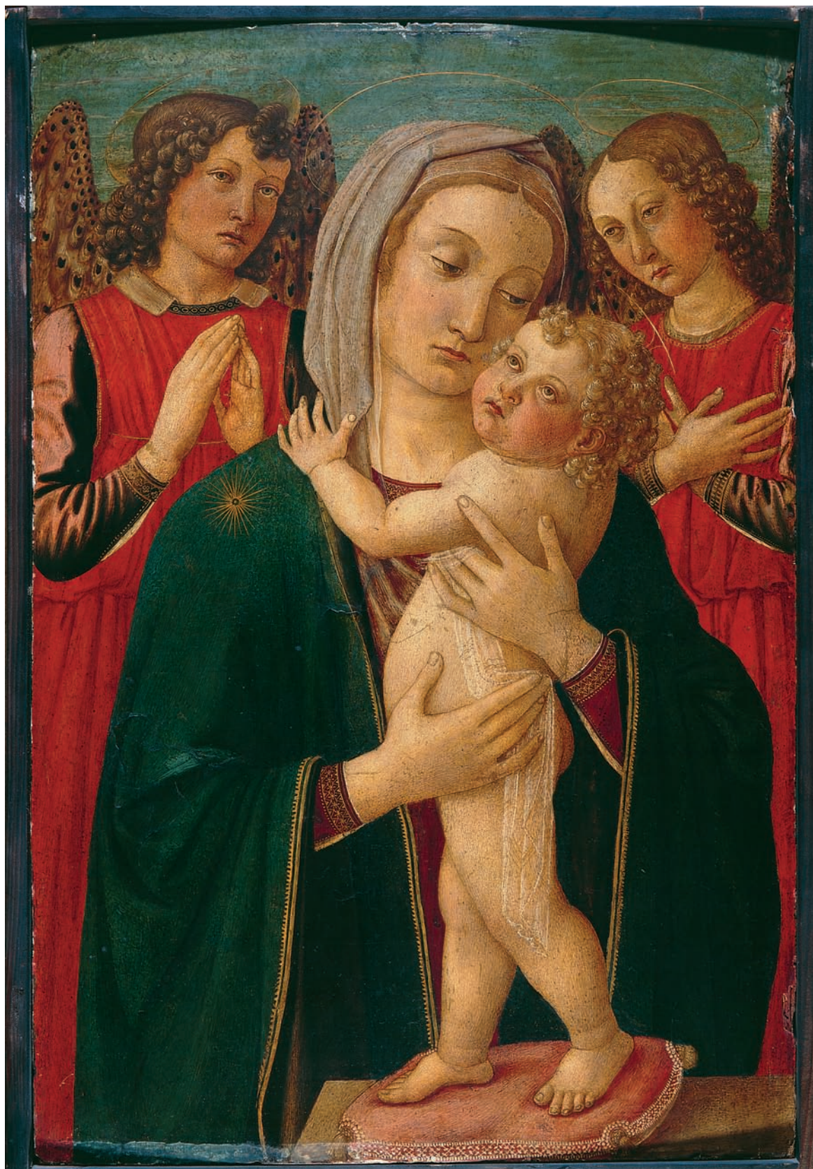
1. Cosimo Rosselli, Bogorodica s Djetetom i dva anđela , tempera na dasci, 69,3 x 46,4 cm, inv. br. SG-56, Strossmayerova galerija starih majstora HAZU Cosimo Rosselli, The Virgin with Child and Two Angels, tempera on wood, 69.3 x 46.4 cm, inv. nr. SG-56, Strossmayer Gallery of Old Masters HAZU