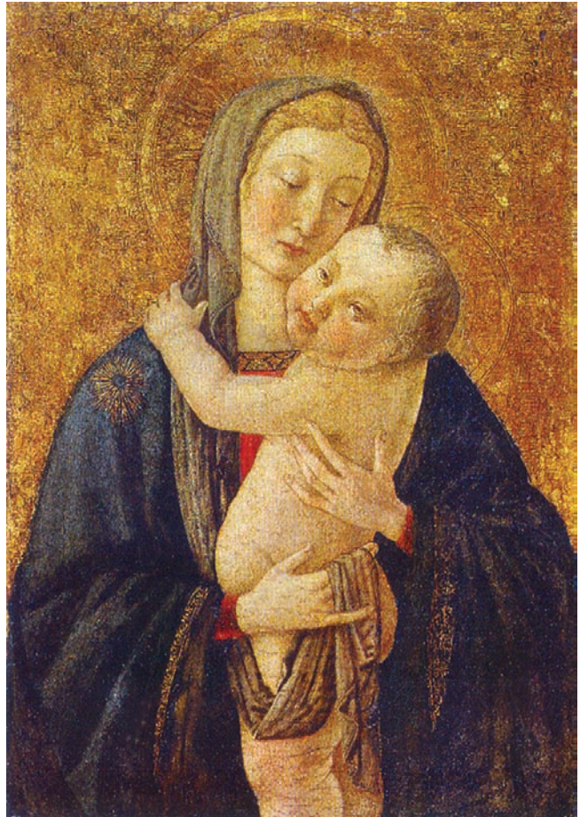
3. Cosimo Rosselli, Bogorodica s Djetetom , tempera na dasci, 42,2 x 29,2 cm, Walters Art Gallery, Baltimore Cosimo Rosselli, The Virgin with Child , tempera on wood, 42,2 x 29,2 cm, Walters Art Gallery, Baltimore

zabunom citirao umjesto imena njegova sina, slikara čije je ime Giusto d'Andrea di Giusto (1440. – Firenca, 1496.) 38 i koji generacijski pripada onim firentinskim slikarima u čijem je krugu moguće tražiti autora slike. Giusto d'Andrea ponikao je u krugu utjecaja Filippa Lippija, bio je učenik u radionici Nerija di Bicci i suradnik Benozza Gozzolija. Kako su njegova jedina sigurno utvrđena djela neke freske u vrlo lošem stanju na fasadi crkve Santa Maria a Peretola (Firenca), a djelima koja su nekada Berenson te Cavacaselle i Crowe smatrali njegovima već je u doba kada je iznesen ovaj atributivni prijedlog utvrđena pripadnost opusu Domenica di Michelino, 39 Giusto d'Andrea ostao je još jedno od »imena bez opusa« u firentinskome slikarstvu 15. stoljeća. 40 Njegov je opus danas toliko nedefiniran da ovaj atributivni prijedlog nije moguće kritički analizirati.