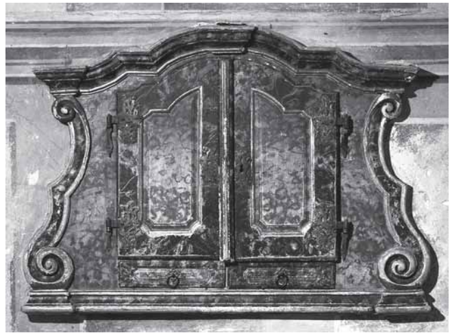
Trški Vrh, crkva Majke Božje Jeruzalemske. Ugrađeni ormarčić u svetištu, druga pol. 18. st.

Trški Vrh, Holy Virgin of Jerusalem, the fitted cupboard in the sanctuary, after 1750