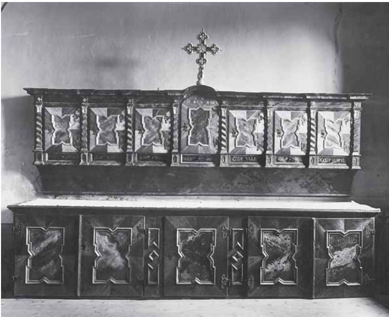
Kamensko, crkva Majke Božje Snježne. Ormar u sakristiji, prva pol. 18. st. Marmorizacija G. Taller Kamensko, Holy Virgin of Snow, the sacristy closet, 18 th century, marmorisation by G. Taller