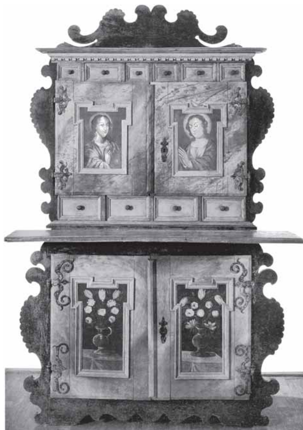
Sakristijski ormar, Muzej grada Ozlja, oko 1670. The sacristy closet, The Ozalj Museum, around 1670

udjela i na ormaru na oratoriju, u njegovu središnjem dijelu nadgradnje, u kojem se nalazi niša rezbarenog okvira u kojoj je smješteno raspelo. Srodnost oblika okvira niše s okvirom retabla oltara sv. Križa i smještaj raspela mogli bi potvrditi tu pretpostavku. Neki kiparski elementi na orguljama također upućuju na rogatečku radionicu Antuna Mersija. 15