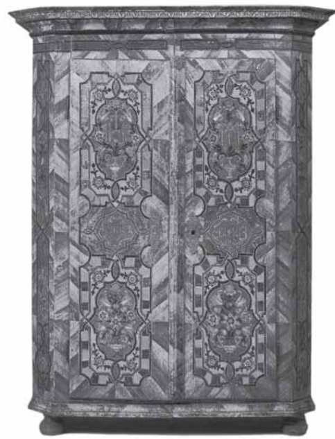
Ormar, oko 1800. (H. Nemeč, Alpenlandische Bauernkunst) Wardrobe, around 1800 (H. Nemeč, Alpenlandische Bauernkunst)

golemi korpus ugrađen je u zidnu plohu oratorija, koju prati gornjom i donjom obrisnom linijom. Konceptija gradbenog sklopa vrlo je zanimljiva. Središnji dio sastoji se od dvodijelnog ormara s visokom nadgradnjom do linije svoda. Flankiraju ga dva bočna u prostor istaknuta vertikalna korpusa, čija visina također dopire do svoda. Međusobno su svi spomenuti dijelovi spojeni u jednu cjelinu. Naglašena arhitektonika raščlambe oplošja ormara primjenom njezinih elemenata na osobito istaknut način ukazuje na tip ormara blizak tzv. fasadnom ormaru.