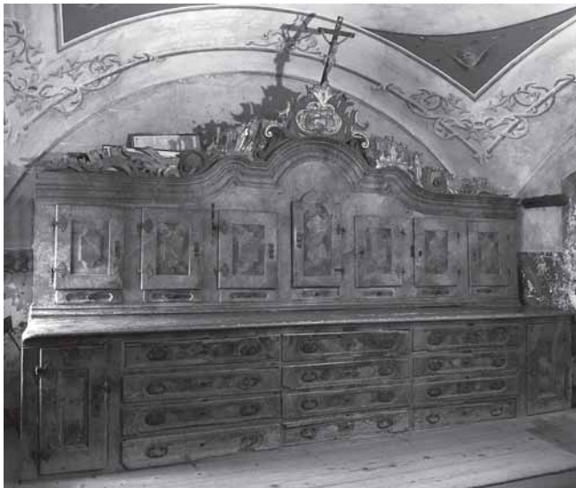
Trški Vrh, crkva Majke Božje Jeruzalemske. Ormar u sakristiji, 1756. Trški Vrh, Holy Virgin of Jerusalem, the sacristy closet, 1756