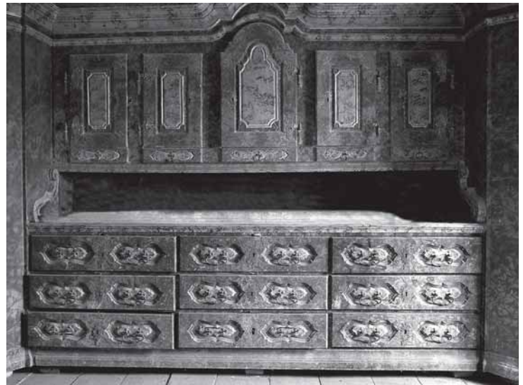
Trški Vrh, crkva Majke Božje Jeruzalemske. Ormar na oratoriju, poslije 1760.