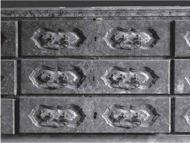
Trški Vrh, crkva Majke Božje Jeruzalemske. Detalj ormara na oratoriju

Trški Vrh, Holy Virgin of Jerusalem, the oratory closet, detail