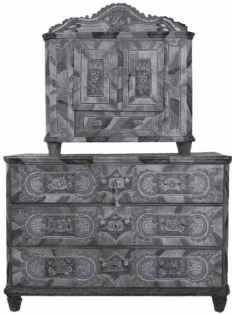
Dvodjeli ormarić, 1830. (H. Nemeč, Alpenlandische Bauernkunst) Two-piece cupboard, 1830 (H. Nemeč, Alpenlandische Bauernkunst)