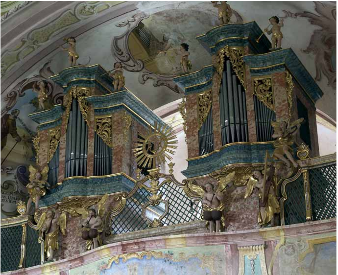
Trški Vrh, crkva Majke Božje Jeruzalemske. A. Römer, orgulje, polikromija i pozlata Franjo Krassnig, oko 1763. Trški Vrh, Holy Virgin of Jerusalem, organ by A. Römer, polychromy and gilding by Franjo Krassnig, around 1763

Likovne značajke toga ormara, bez obzira na neke sličnosti u temeljnom gradbeno-oblikovnom sklopu s ormarom u sakristiji kao i s ormarom iz krapinske crkve, ipak su drugačijeg karaktera. Njegova masa artikulirana na već spomenuti način u cjelokupnom dojmu podsjeća na korpus istovremene oltarne arhitekture.