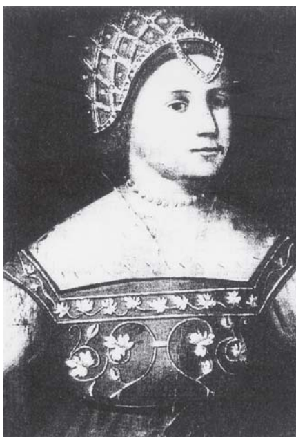
Nepoznati slikar, Portret žene (Museo Civico, Padova) Unknown painter, Portrait of a woman