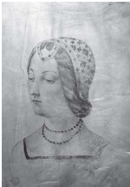
Baldassare Fiamingo (?), Portret Laure (crtež u rukopisu Petrarkinog kanconijera Rerum vulgarium fragmenta , ms. Plut. 41.1, c. IX, Biblioteca Laurenziana, Firenca)

Baldassare Fiamingo (?), Laura's portrait