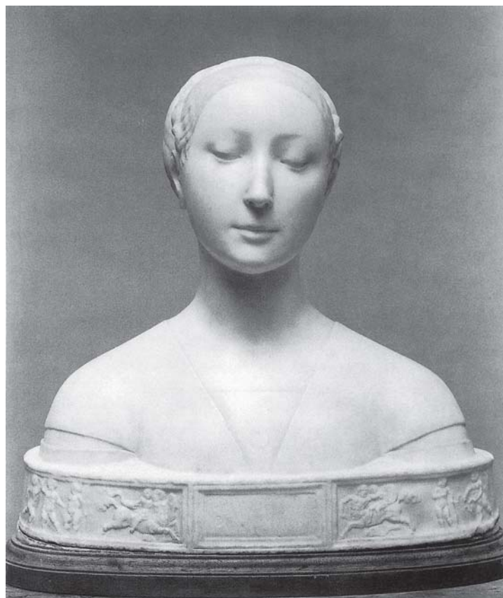
Francesco Laurana, Portret nepoznate žene (Washington) Francesco Laurana, Portrait of an unknown woman

ukrašena s dva reda perli, kose spletene iznad potiljka, koja kao vijenac proviruje ispod kapice ukrašene perlama i dijamantom na čelu. Ona je identična po svim detaljima fizionomije, odjeće i frizure s poprsjem Laure iz Beča.