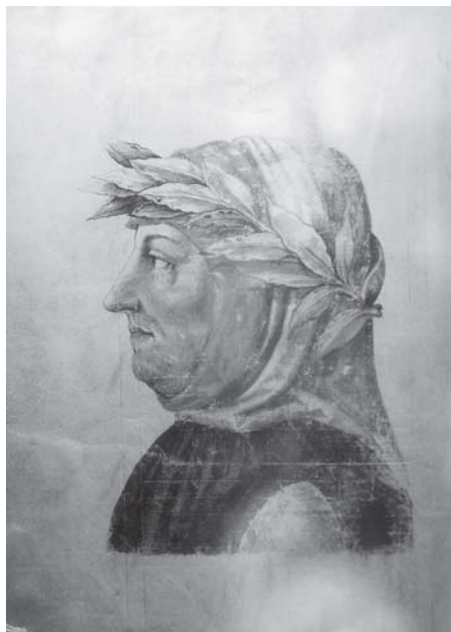
Baldassare Fiamingo (?), Portret Petrarce (crtež u rukopisu Petrarkinog kanconijera Rerum vulgarium fragmenta , ms. Plut. 41.1, c. IX, Biblioteca Laurenziana, Firenca)

Baldassare Fiamingo (?), Laura's portrait