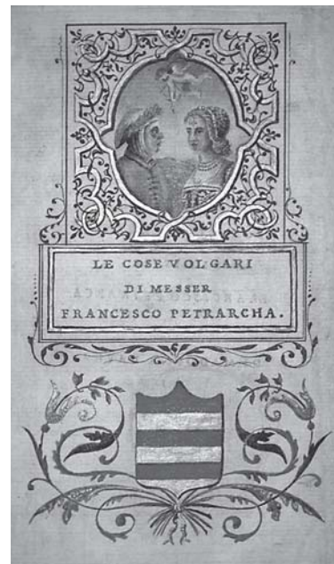
Nepoznati slikar, Minijatura s likovima Petrarce i Laure , Le cose volgari di messer Francesco Petrarca/et tolto con sommissima diligenza dallo scritto di mano medesima dal Poeta hauuto da M. Pietro Bembo (Wellesley College, Plimpton)

Baldassare Fiamingo (?), Petrarca's portrait