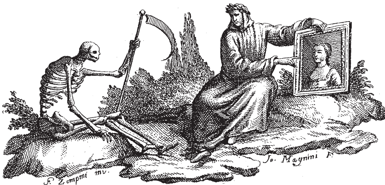
G. Zompini – B. Crivellari, Petrarca pokazuje Smrti Laurin portret (grafika u knjizi Le Rime del Petrarca brevemente esposte per Ludovico Castelvetro , Biblioteca nazionale centrale, Rim) G. B. Moretti – B. Crivellari, Petrarca shows Laura's portrait to the Death