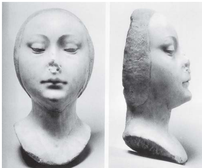
Atr. Francesco Laurana i radionica, Maska nepoznate žene (Laura?) (New York, Metropolitan Museum)

Attr. Francesco Laurana and workshop, Mask of an unknown woman (Laura?)