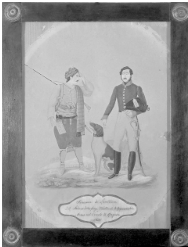
Portret Simeona de Lantana, akvarel, 1830. Portrait of Simeon de Lantana, watercolor, 1830

pred samom zgradom, uređuje se vrt, a održavanje zgrade je redovito. Giuseppe de Lantana je 1882. dao otući boju sa zidova u nekim sobama prizemlja da bi pronašao slikarije koje je njegov otac Marcantonio naslikao kao dječak od 12 godina. Pronašao ih je samo u jugozapadnoj sobi i pomno precrtao, a kao posebnost je zabilježio da su »freske« bile obojane »sokovima iscijedenim iz biljaka«. 18 U sačuvanim Giuseppeovim crtežima možemo prepoznati dječачku maštu, ali i moguće bilježenje događaja i života oko dvorca u vrijeme oko 1815. godine, jer se u svakodnevne poljopriv-