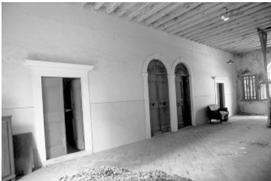
Ljetnikovac Lantana, predvorje prvoga kata, 1993. Lantana villa, second floor hall, 1993

skakao je oko nas i on je bio jedino živo stvorenje, koje se moglo čuti i vidjeti. Vratili smo se u kuću, hodali po sobama dolje i gore, sve su bile otvorene, sve pune starog namještaja, starih nepoznatih slika; pune raznih prirodnih rariteta. Osjećala sam se kao u začaranoj šumi. Kad je netko zadnji put grabio vodu iz bunara? Ima li još vode u njemu? Može li još zvono u kapeli zvoniti? Jesmo li mi uopće u kući Lantana? Konačno, kad sam se već ugodno smjestila u ležaljci u spavaćoj sobi, kao da sam u svojoj, čula sam iz salona: »Signor Conte!« Conte, jedan uljudan, jednostavan čovjek srednjih godina, koji je dugo godina služio kao serdar na turskoj granici, nije bio ništa manje iznenađen od dvojice gospode, što jedna dama izlazi iz tuđe spavaće sobe. Kad smo mu dali pismo gospođe Cattani, sve mu je postalo jasno i odmah je preuzeo neočekivanu ulogu dobra domaćina i pitao nas hoćemo li ovdje prenoćiti. Kad nam je ponudio kavu, ja sam odbila zamolivši ga vode s malo vina. Nasmijali su se mojem slobodno izraženom zahtjevu i uskoro smo pili domaće hladno i malo pjenušavo vino.