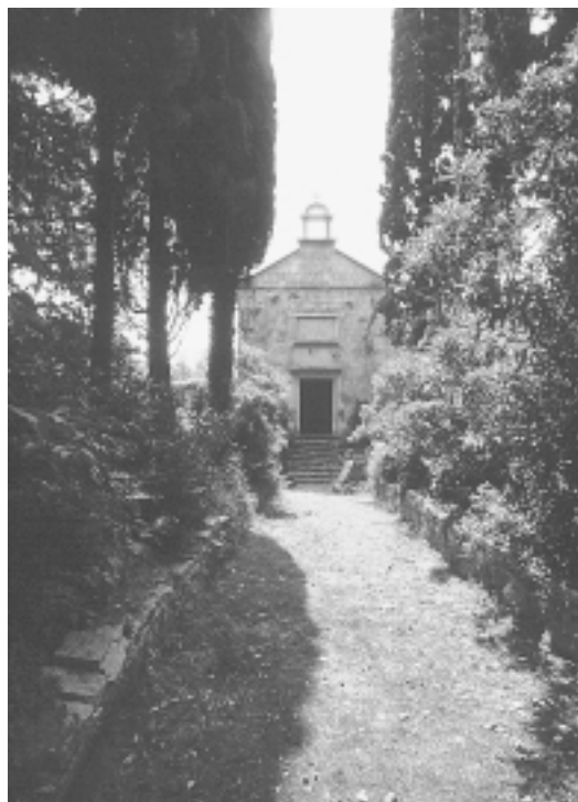
Ljetnikovac Lantana, pogled na vrt i kapelu, 1993. Lantana villa, view of the garden and chapel, 1993

Ugljan je velik otok koji zatvara zadarski kanal. Na jednom njegovom visokom brdu dominira Kaštel sv. Mihovila. Ispod njega leži Sv. Eufemija (danas Sutomišćica, o. pr.) gdje stanuje conte Lantana, za kojega smo imali pismo gđe Cattani. Bilo je malo vjetra, pa smo stigli tek oko 6 sati. Mali dvorac grofa Lantane nalazi se nedaleko od obale. Kratka aleja vodi do malog dvorišta okružena zidom, par stepenica vodi u predvorje, koje na suprotnoj strani ima vrata, što vode u mali vrt. I taj je bio okružen zidovima, naokolo su visili grozdovi, doduše nezreli, a mala, bijelo okrečena kapela virila je iz bršljana. Vrt je bio prazan, isto tako i dvorište. Jedan ljubazan pas