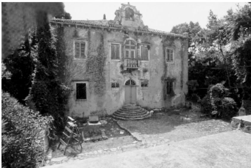
Ljetnikovac Lantana, pogled na pročelje, 1993. Lantana villa, view of the façade, 1993

dine, što se može pročitati s ploče na ulaznim vratima, koja spominje da ju je podigao Marcantonio Lantana, a posvetio nadbiskup Bernardo Florio. Kapela je građena u klesanom kamenu, 8 a prilazi joj se preko osam stuba, pa svojim povišenim položajem ostvaruje ravnotežu sa susjednim ljetnikovcem. Pravokutnog je tlocrta, nadsvođena križnim svodom, koji zasijeca noseće zidove u gornjoj trećini njihove visine, gdje se oblikuje bogato profilirani vijenac. Nad vijencem se otvara po jedan polukružni prozor na sjevernom i južnom licu kapele. Pročelje završava zabatom, koji je omeđen jednostavnim vijencem, a na vrhu je postolje za monofornu preslicu. 9 Zapadni portal ima jednostavnu profilaciju, a bočna vrata na južnom zidu komuniciraju s prostorom izvan ogradenog terena ljetnikovca. U unutrašnjosti kapela ima višebojni mramorni pod, a jednostavni barokni oltar podignut je na dvije stube i uvučen u plitku nišu. 10 U kapeli se naziru tragovi klasicističkog oslika, a sačuvana je i posvetna nadgrobna ploča, kojoj nažalost nedostaje središnji ukras. 11