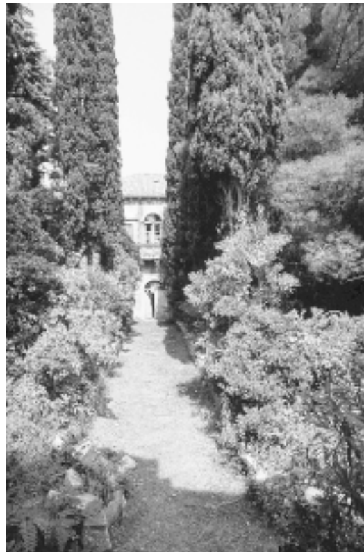
Ljetnikovac Lantana, pogled od kapele prema zgradi ljetnikovca, 1993. Lantana villa, view from the chapel towards the summerhouse, 1993