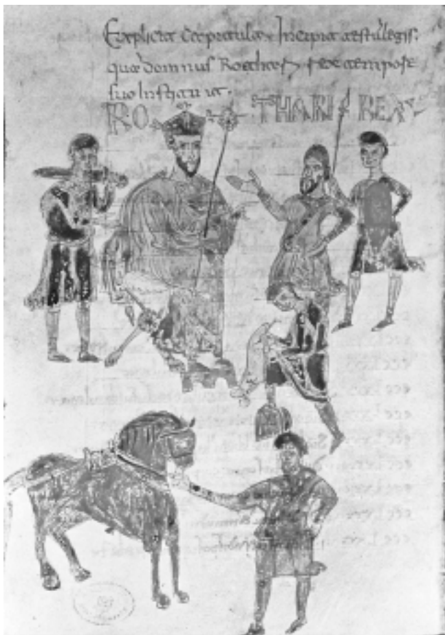
Prikaz kralja Rotarija u Zakoniku iz 9/10. st. Figure of King Rotarius in Codex, 9 th /10 th cent.

da ostaje i u pozadini svakog iskazivanja ili usađivanja nebeskih zakona u svjetovnim, zemaljskim okruženjima. 100