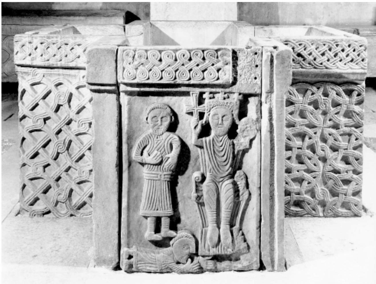
Zdenac krstionice u Splitu iz 12. stoljeća Baptismal font, Split, 12 th cent.

ishodišta našem reljefu, tako i trajnost, ujedno tradicionalnu važnost njegove teme.