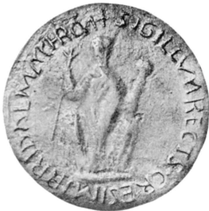
Pečat kralja Petra Krešimira IV iz 1071. godine Seal of King Petar Krešimir IV, 1071

kleči, ali su to bez osobnog zalaganja silom svugdje jednakih zakona priskrbili svi okrunjeni. U pravilu, dakle, to je pripadalo čašćenju onih koji su se dičili naslovom vicarius Christi = Rex iustitiae , te se okruživali odgovarajućim povlasticama koje zorno oslikava reljef u Splitu. Inačicu u likovnom iskazivanju čina obistinjanog na dvorovima i u crkvama, svakako tvori postava lika postrance, a ne ispod nogu vladara što bi prema uopćenim tvrdnjama samo značilo da nije riječ o univerzalnome gospodaru ili nositelju najvišeg upravnog reda. Kako ni u tipu odjeće nije uočena nikakva razlika od uobičajene na imperatorima ili basileusima , a samoj se kruni utvrdila relativna osobitost, to jača uvjerenje o regionalnome vladaru, dajući jednu okosnicu i našim tumačenjima.