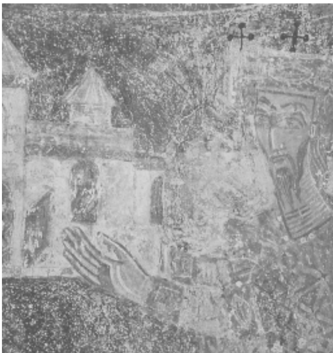
Kralj donator na freski u crkvi sv. Mihovila kraj Stona, kasno 11. st. The Donor King, fresco in St. Michael's Church near Ston, late 11 th cent.