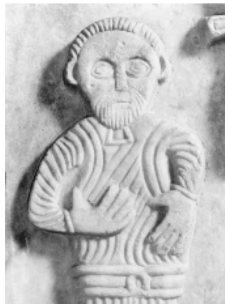
Ostaci otklesanog rotulusa iz ruku kraljeva pratitelja Remains of chiselled-off scroll in hand of king's escort

vatelj Božjeg reda) kao da podvodi zbiljnost svojeg ljudskog okružja. 38 Pod njegovim vodstvom – htjelo se reći – sigurnije se stupa u bratstvo s Kristom na putu k savršenstvu Nebeskoga grada. Time je poglavito naznačena visoka vrsnoća njegove vladavine, te je predložen kao Lex animata in terris , jer je po svemu i ovdje oličenje Božanske pravde, kako iz opće teorije i prakse srednjeg vijeka bijaše utkano u shvaćanje časti i vršenje dužnosti svakog suverena.