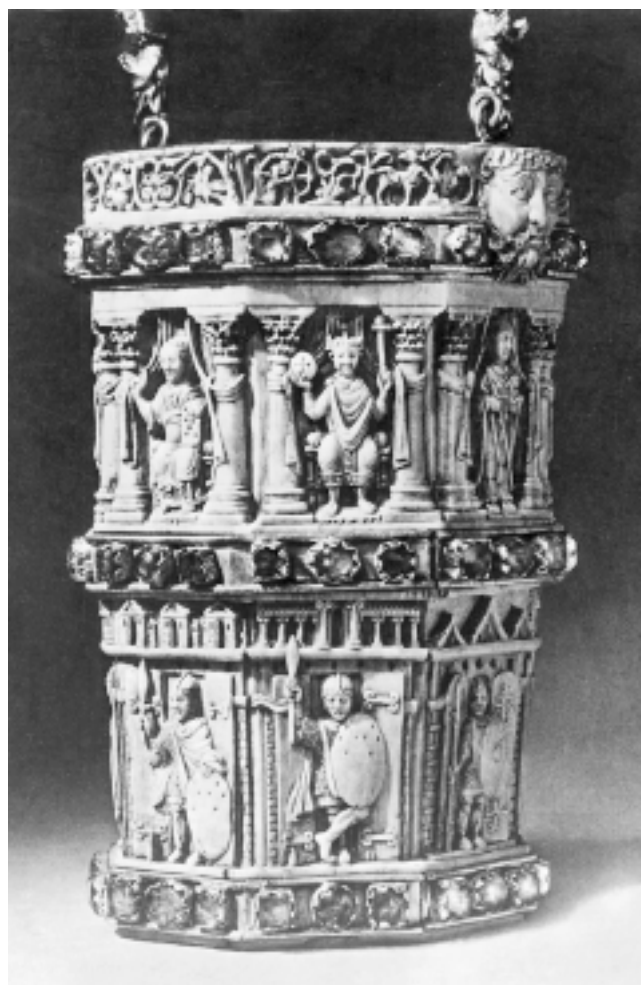
Lik Henrika II na bjelokosnom vjedarcetu iz 11. st. Figure of Henry II on ivory vessel, 11 th cent.

Višestruko se izdvajajući veličinom kao i građom, te ukupnom osobitošću, reljef u Splitu je vrlo zaseban i u pogledu značenja svoje slike. Sukladno pojavno-fizičkim vrsnoćama, on je i sadržajno izuzetan jer noseći ikonografske čimbenike alegorijskog lika kristijanizirane Pobjede – Victoriae , slijedi obrazac općeg tipa Christus gerens . Tako, u biti rađen secundum non typicam figuram Christi rijetko viđenom, premda objašnjivom linijom uključuje sastavnice odnosa Sacerdos – Rex . To će potvrditi unošenje vladareva lika na exultima, kao i spominjanje u laudama, zasigurno izvedeno i u Dalmaciji. Oni proistječu iz proslavljanja povijesnog trenutka što se, međutim, ne oslanja izričito na gotovo predodređeni sam lik vladara, nego prije oslikava događanja koja tumače ulogu glavnog lika sljedno navedenim njegovim ikonografskim prauzorima. Riječ je, dakle, o rješenju u kojem se kristaliziraju kako potanji uvjeti, tako i okvirne podudar-