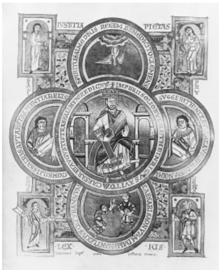
Henrik II kao Rex iustus na naslovnici Evanđelistara iz 1022. god. Henry II as Rex Iustus on front page of Evangelistarium, 1022

sudjelovanje isključivo svjetovnih lica, dakako, podvodi se u povijesni tip kompozicije koje se ne usredotočuju na Krista poput velike većine ondašnjih figuralnih ostvarenja (otud pojam Christ centred art ). 79 Zato joj ni smisao ne razrješava neki liturgijski napatuk ili fraza, kako bi se moglo očekivati s obzirom da je iz uređaja oltara.