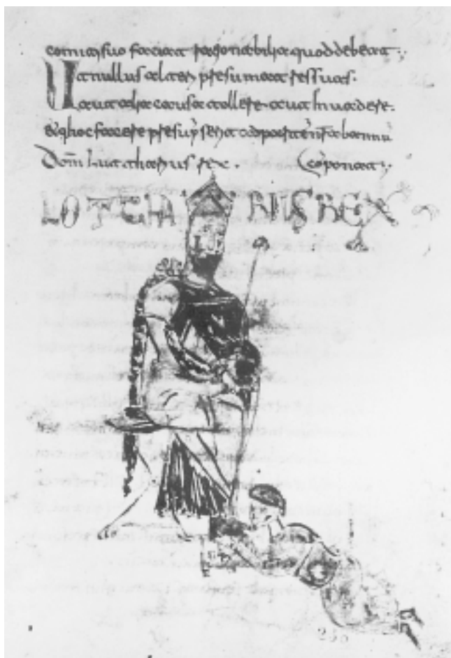
Prikaz kralja Lothara u knjizi Lombardskih zakona Figure of King Lothar in book of Lombardian laws