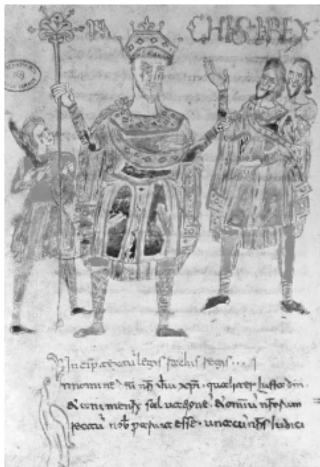
Prikaz kralja Rathisa u Zakoniku iz 9/10. st. Figure of King Rathis in Codex, 9 th /10 th cent.

strane vladara njihovim podanicima. Razumljivo je da su time objavljivali savezništva, obostrano tumačili svoja prava, prvi urođena ili dana po višim silama te nošena dično i s dostojanstvom, a drugi primljena s poniznošću i osjećajem trajnog duga. Međutim, u ceremonijalnoj ikonografiji statične likovne predodžbe, a uz shematski plastički jezik prije uspona romanike, nemoguće je razlikovati čin primanja od čina davanja. Obvezatno ipak, kao na nizu primjera, tako i u Splitu, onaj koji sadržajno temeljni dar drži stoji na nogama pokraj sjedećeg višeg dostojanstvenika, koji nepomičnim stavom raskriva i glavnu svoju ulogu. Tako je u biti dvostrano slavljen onaj koji je u društvenoj hijerarhiji i moralnoj ljestvici ionako stajao na višem mjestu, natprirodno sposoban i moguć snaženju slabijih koji mu u pravilu ostaju postrance. Njima pak različito označeni nadmoćni lik gotovo redovito bijaše naručitelj ili isplativatelj takvih, bilo zavjetnih bilo komemorativnih spomenika, ali je od takvih uopćenja za naš reljef malo korisnih pokazatelja. 89