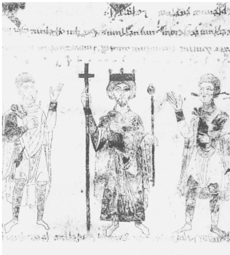
Prikaz vladara na exultetu iz Monte Cassina, 11. st. Figure of ruler on exultet roll from Monte Cassino, 11 th cent.

skog izraza širila s izrazitim osjećajem za poštovanje mjesnih predaja i dosega krajeva u koje je sezala.