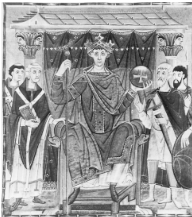
Minijatura Otona II s dvorskom svitom, 10/11. st. Miniature of Otto II with entourage, 10 th /11 th cent.

naručitelja voljnog i sposobnog takvom činu, pa najposlije i umjetnika spremnog udovoljenju nipošto običnog ili prosječnog zadatka. Tako se u zaustavljanju jednog povijesnog čina rađa čak naboj dramatičnosti kojoj izrazitost daje jasnoća dijelom prouzročena sviješću o predočenju jednog u biti svjetovnog, nedvojbeno celebracijskog ali ne i posvetom uzvišenog sadržaja.