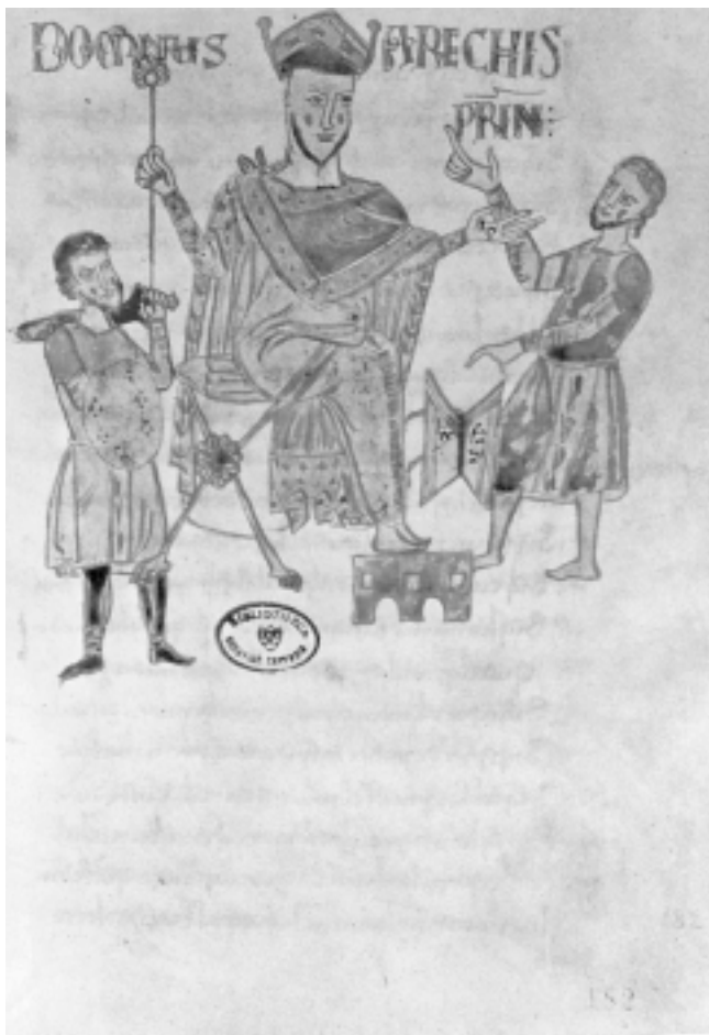
Prikaz kralja Arechisa u Zakoniku iz 9/10. st. Figure of King Arechis in Codex, 9 th /10 th cent.