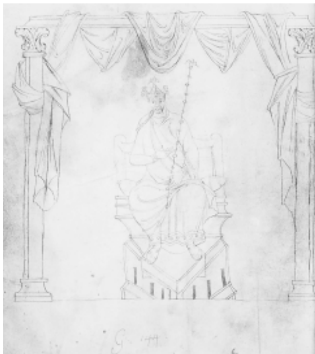
Crtež Karla Velikog (ili Karla Čelavog) u Zborniku Sv. Ansegisa iz Metza, 10/11. st.

Drawing of Charles the Great (or Charles the Bald) in Collection of Capitularies, by St. Ansegisus of Metz, 10 th /11 th cent.