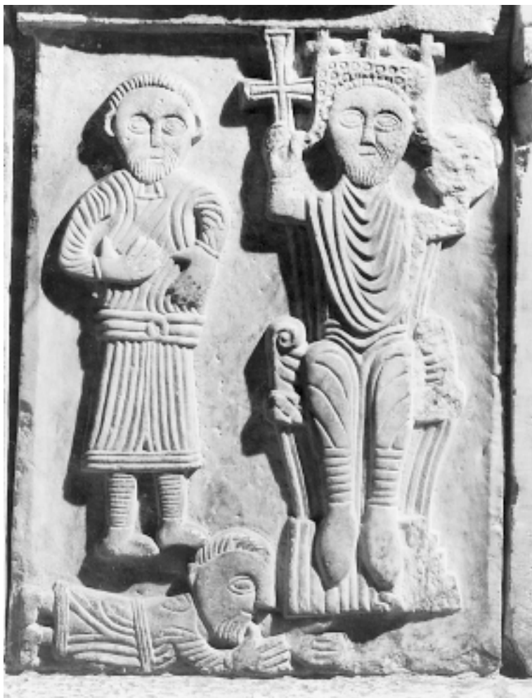
Reljef s prikazom zemaljskog vladara iz 11. stoljeća Relief showing earthly ruler, 11 th cent.

S obzirom na sve što se očitava suprotiva viđenju Krista, jedina druga mogućnost u frontalno postavljenom i okrunjenom liku na prijestolju, bez dvojbe jest prikaz svjetovnoga vladara. Ponajbliže onoga koji s križem – potvrdom nepobjedivosti u ruci kao da prati uzvik: Benedictus qui venit in nomine Domini , uvriježen kako u crkvenoj, tako i vjerskoj ceremoniji ranosrednjovjekovne Europe. 34 Premda rijetka, njegova pojava na liturgičkom namještaju načelno i po tome nije isključena, jer mu uloga Božjeg zastupnika ionako bijaše povjerena s posvetnim značenjima. Stoga se Crkva u neko doba nužno oslanjala na njegovu moć priznavajući je ravnom svojoj moći; čak se i obredno s oltara uloga kralja u tom smislu objavljivala i pozdravom potvrđivala, donekle ujednačavajući smisao svećeničke i vladarske dužnosti ili službe. Nositelji krune, naime, bijahu uzdignuti na položaj središnje figure u povijesti, koja je u kršćanskoj civilizaciji obvezatno i povijest Spasenja, odgovornost za obistinjenje kojeg preuzima svaki srednjovjekovni kralj, ponajprije kao legitimni zakonodavac. 35 On je k tome i onaj koji po dužnosti, umjesto izravnih službenika Crkve, obavlja zemaljske poslove povezane navlastito s održanjem Božje pravde kao zalogu Spasenju ljudima.