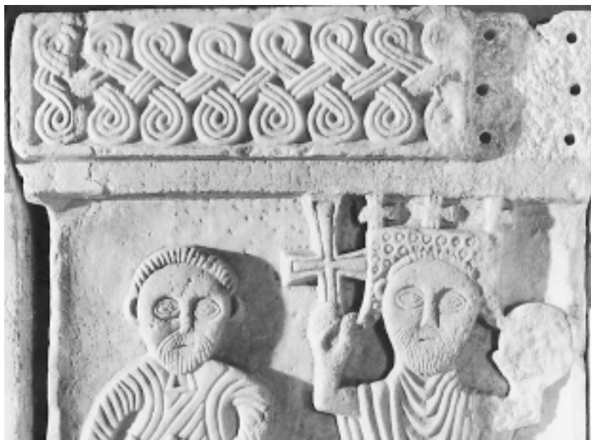
Dio pluteja s brisanim natpisom Part of pluteus with erased inscription