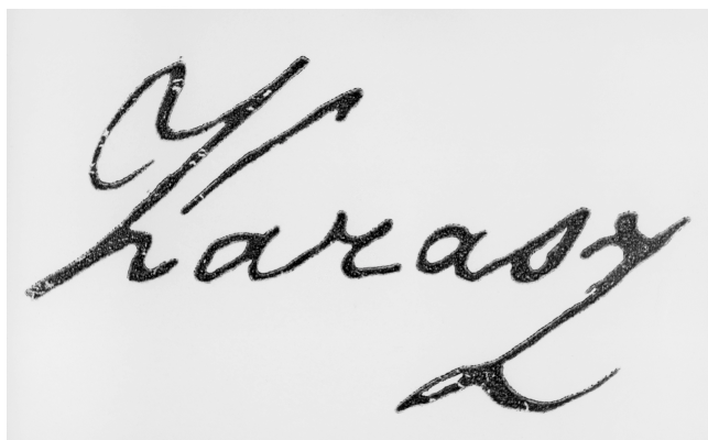
Karasov autograf Karas' autograph

Inscription Karafs on the reverse of the canvas Madonna and Child