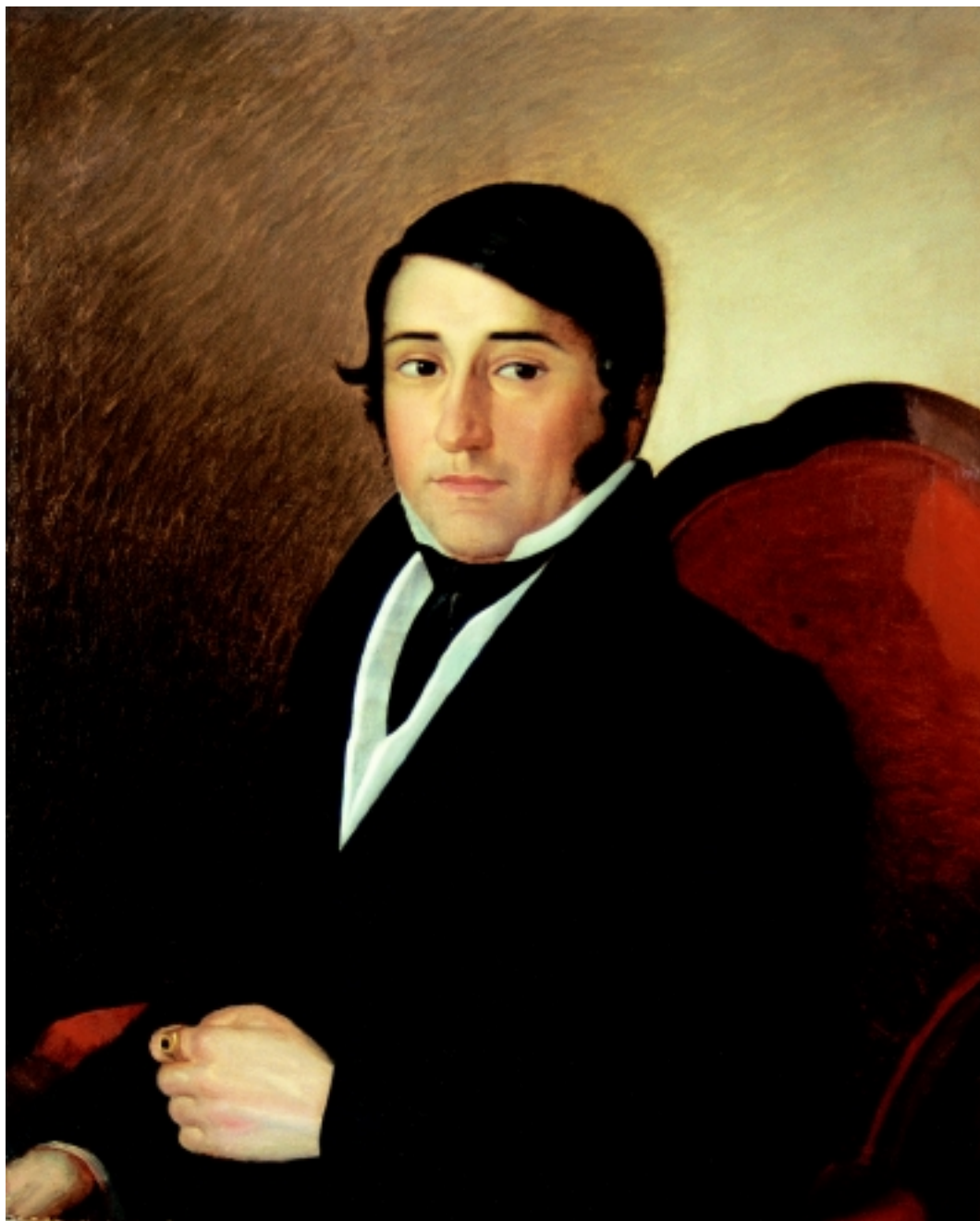
Vjekoslav Karas, Portret nepoznata muškarca , Gradski muzej Karlovac Vjekoslav Karas, Portrait of an unknown man, City Museum Karlovac