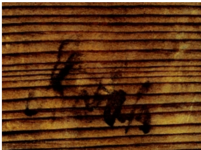
Natpis Karafs na slijepom okviru slike Portret nepoznata muškarca

Naknadno je svoje mišljenje iznio i Vladimir Marković ustvrdivši kako slika Portret nepoznata muškarca »u postavi portretiranog lika, crtačkom oblikovanju pojedinih detalja, mjestimice veoma sumarnoj njihovoj prezentaciji te istančanoj kromatici, osobito bijelih površina doista pokazuje znatne podudarnosti s pouzdano Karasovim radovima«.