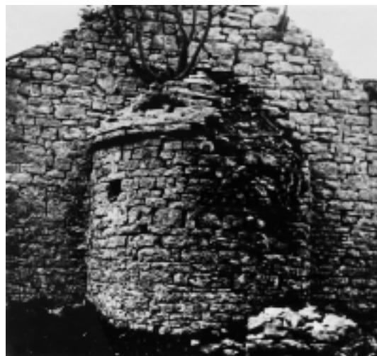
Crkva Sv. Ilije kod Dvigrada, apside Church of St. Elias near Dvigrad, apse

Church of St. Christopher near Rovinj, east and north facade