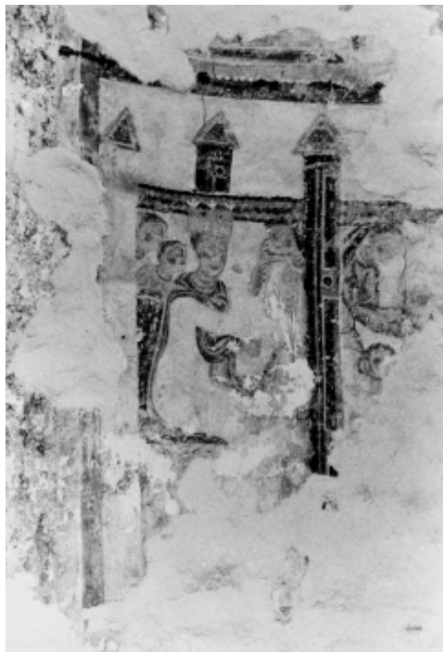
Crkva Sv. Mihovila u Kloštru nad Limom, detalj freske u apside Church of St. Michael in Kloštar nad Limom, detail of the apse fresco

kompleksa Sv. Mihovila i nalaza skulptura otkrivenih za vrijeme posljednjih restauracija. 6 Značajan je i prilog D. Klenu, koji je uvjerljivom dokumentacijom dokazao da je Darovnica grofice Acziche iz 1040. godine, iz koje se поближе saznaje o gradnji i graditeljima opatije Sv. Mihovila, krivotvorina. 7