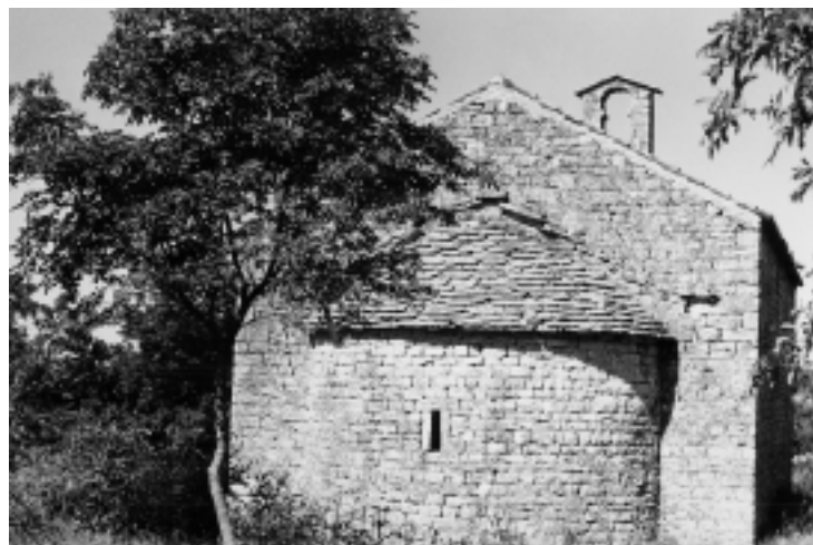
Crkva Sv. Marije Magdalene u Šorićima, začelje

Church of St. Cyprian near Rovinj, view of the apse