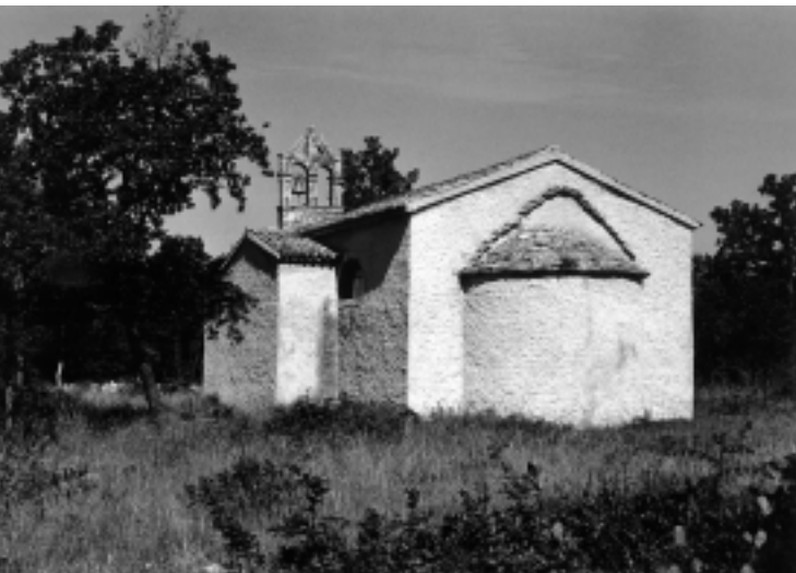
Crkva Sv. Lucije u Selini, pogled na crkvu s jugoistoka

Church of St. Lucy in Selina, view of the church from the south-east