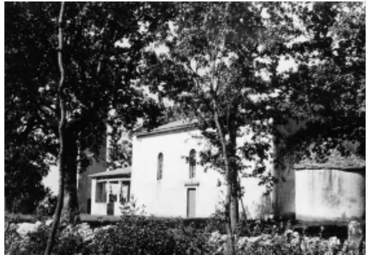
Crkva Sv. Marije kod Žminja, pogled na crkvu s jugoistoka

Church of St. Peter na Krasu, interior, view of the apse