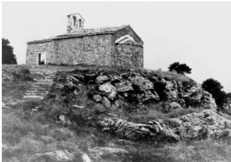
Crkva Sv. Mihovila u Pićnu, pogled na crkvu s jugoistoka

Church of the Holy Cross in Butoniga, apse