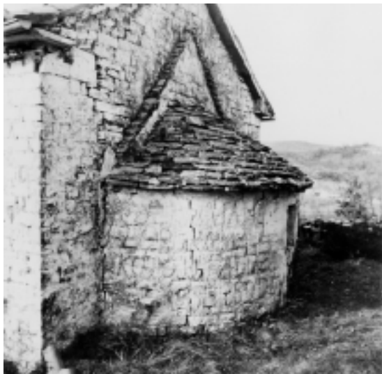
Crkva Sv. Križa u Butonigi, apside

Church of the Holy Cross in Butoniga, apse