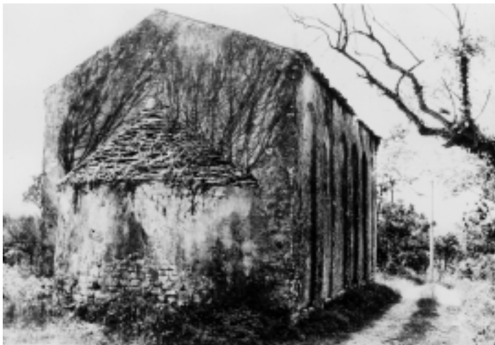
Crkva Sv. Kristofora kod Rovinja, istočna i sjeverna fasada

Church of St. Christopher near Rovinj, east and north facade