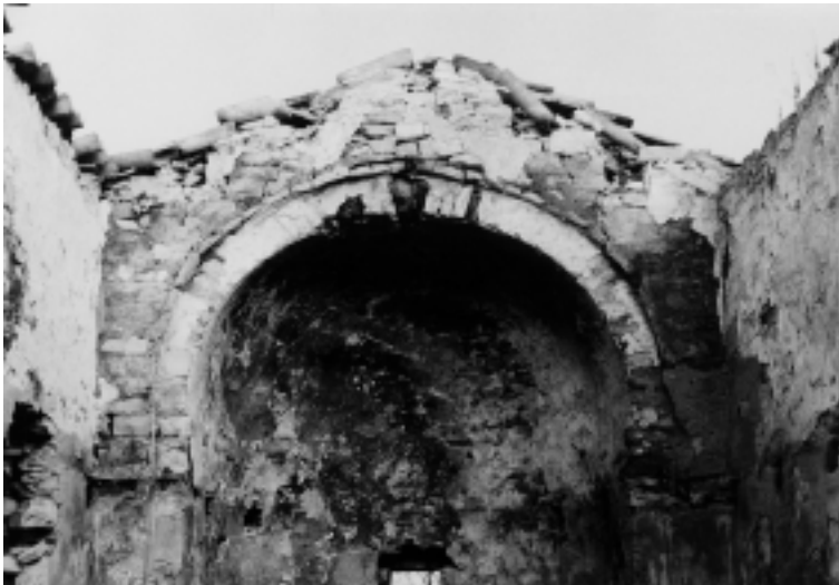
Crkva Sv. Petra u Svetom Petru na Krasu, unutrašnjost, pogled na apsidu

Church of St. Peter na Krasu, interior, view of the apse