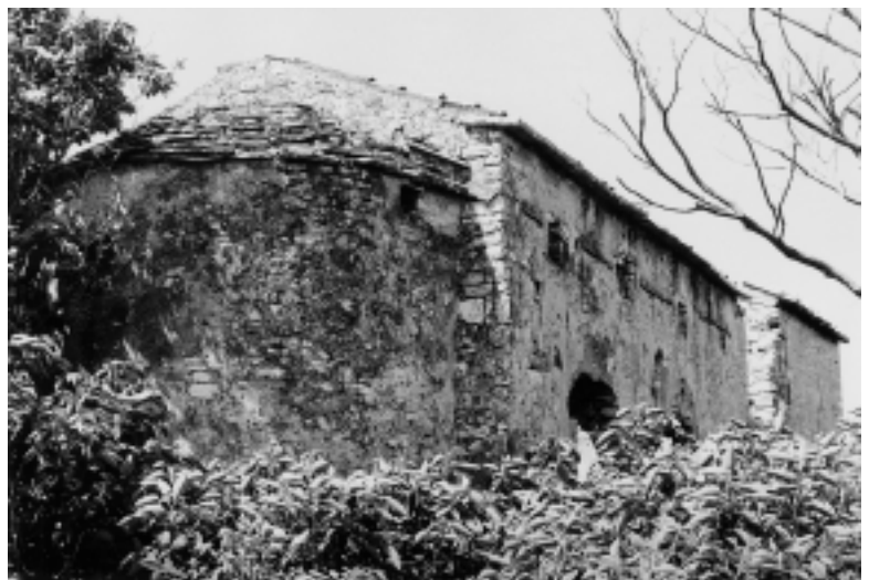
Crkva Sv. Petra u Svetom Petru na Krasu, pogled na crkvu sa sjeveroistoka

Church of St. Lucy in Selina, view of the church from the south-east