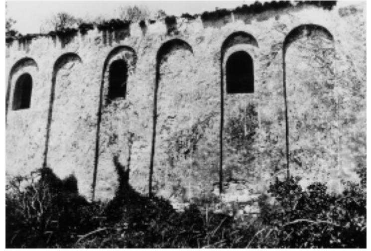
Crkva Sv. Kristofora kod Rovinja, dio sjeverne fasade

Church of St. Christopher near Rovinj, west and north facade