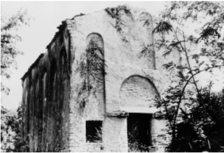
Crkva Sv. Kristofora kod Rovinja, zapadna i sjeverna fasada

Church of St. Christopher near Rovinj, west and north facade