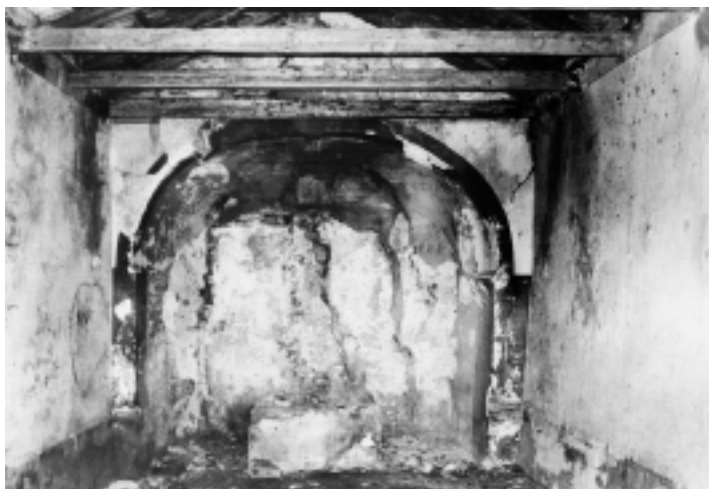
Crkva Sv. Ciprijana kod Rovinja, pogled prema apsidi

Church of St. Cyprian near Rovinj, view of the apse