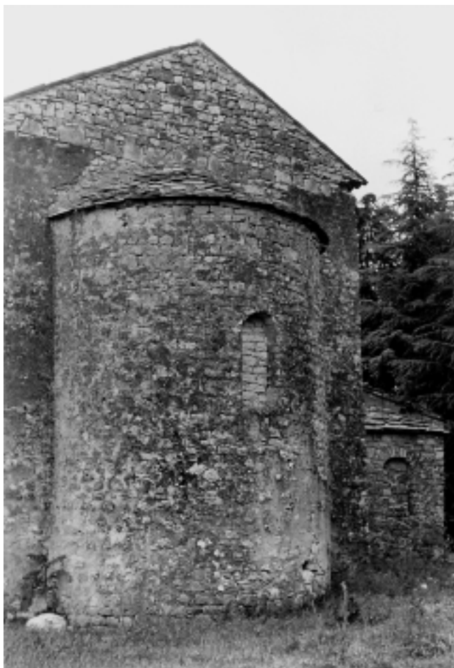
Crkva Sv. Mihovila u Kloštru nad Limom, apside Church of St. Michael in Kloštar nad Limom, apse