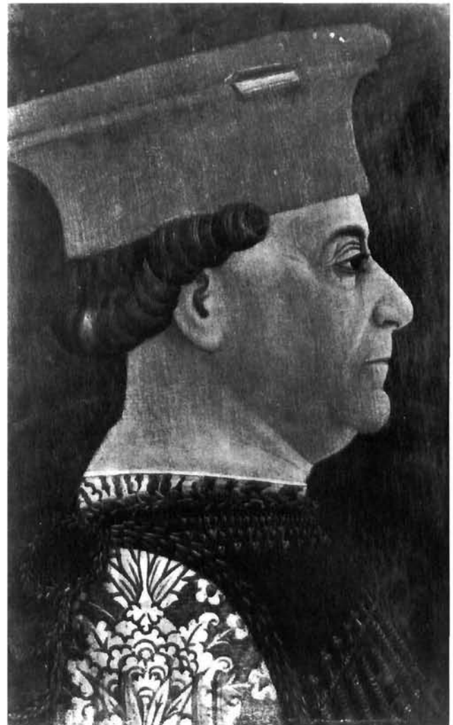
Nepoznati slikar, Portret Francesca Sforze. Brera, Milano Unknown painter, Portrait of Francesco Sforza. Brera, Milan

Zanimljivo je da je u rodbinskim odnosima s Ivanom Paleologom bio Sigismund Malatesta (1417–1468), vojvoda od Riminija, koji je i sam sudjelovao u protuturskim borbama.