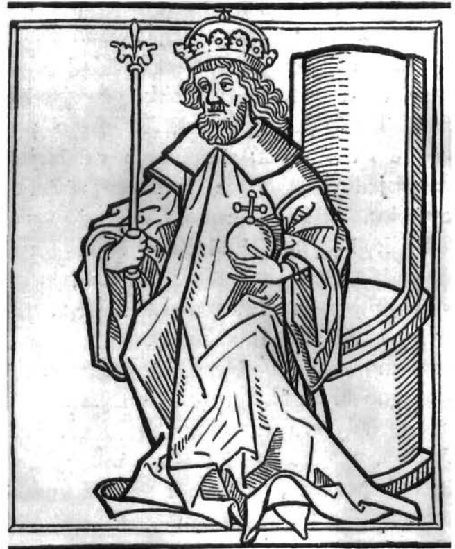
Portret Vladislava II Jagelovića, grafika Portrait of Vladislav II Jagelović, graphic

skog nalazi se mladić (?) ovalnog pravilnog lica s kosom koja završava velikim uvojcima. Poznati su portreti Filipovih sinova – Antuna Burgundijskog (o. 1430–1464. g.) i Karla Smjeloga (1433–1477) Rogiera van der Weydena. Oni prikazuju dvojicu mladih lijepih muškaraca tamne, blago valovite kose i pravilnih crta lica. 43 U doba nastanka Jurjevih glava Antun je imao oko trinaest godina, a Karlo je bio dječak od desetak godina. Bez poznavanja njihovih portreta iz dječjeg doba nemoguće je utvrditi da li je jedan od njih prikazan u opisanoj Jurjevoj glavi.