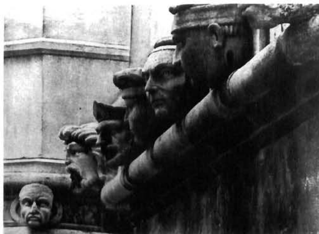
Juraj Dalmatinac, Glave druge apsidi. Šibenik, katedrala Juraj Dalmatinac, heads on the second apse. Šibenik cathedral

Za treću glavu na drugoj apsidi mislilo se da bi mogao biti portret Vergila. Riječ je o glavi obrijanog mlađeg čovjeka živih, širom otvorenih velikih očiju i poluotvorenih usana s lovorovim vijencem u kosi, ispod kojeg se nazire ravna kosa.