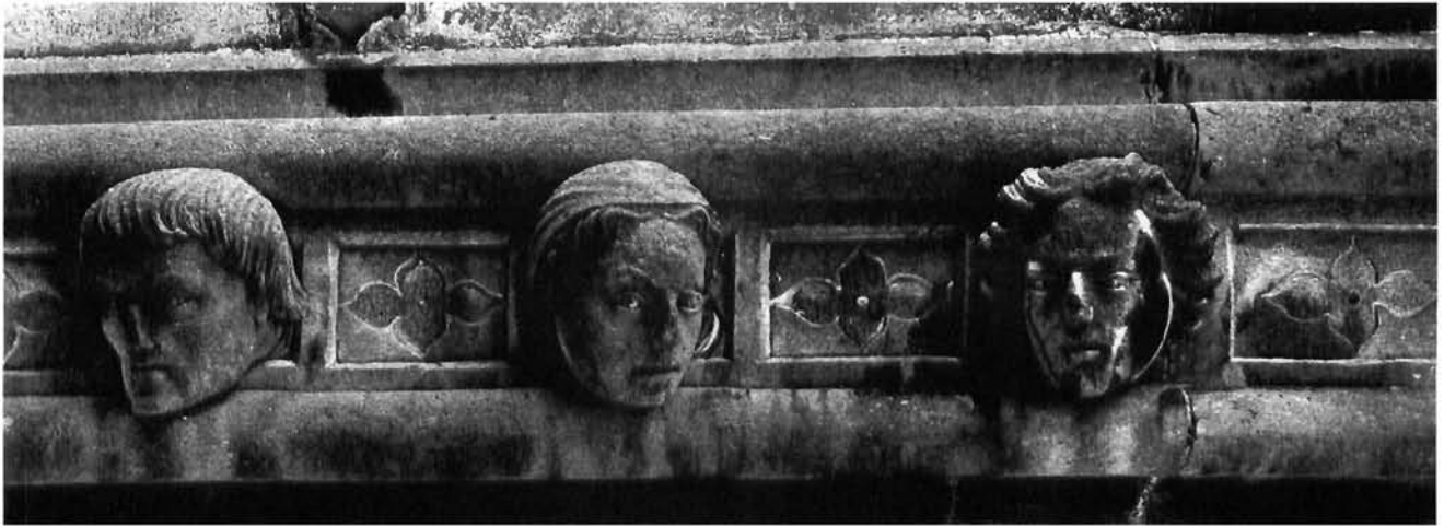
Juraj Dalmatinac, Filip Dobri (?) i dvije nepoznate ličnosti. Šibenik, katedrala Juraj Dalmatinac, Filip Dobri (Philip the Good) and two unknown persons from the Šibenik cathedral

Postoje mnogobrojni portreti Bessariona (o. 1403–1472. g.) odjevenog u kardinalsko ruho, sa crvenom kapicom ili kapuljačom na glavi. Sjetimo se onog prelijepog portreta koji se daje španjolskom renesansnom slikaru Pedru Berruguetteu u »studiolu« Federica da Montefeltro u njegovoj vojvodskoj palači u Urbinu ili pak onog drugog, gotovo karikaturnog Andree Contrarija u Obiurgatio in Platonis calumniatore . Ispod kardinalskog šešira prekrivenog kapuljačom izviruje mudro lice niskog čela uokvireno valovitim kosom i bujnom bradom i brkovima. Podno velikih tamnih obrva, koje imaju oblik valovnice, vire žive oči. Trokutasti obrazi su upravo onakvi kakve je kiparski dočarao Juraj, kao i stisnute mesnate usne, od kojih je donja posebno naglašena, i brade uvijene u dva gusta pramena vidno izbočene prema vani. Njegov lik prepoznao je Ginzburg na freskama P. della Francesca u Arezzu ( Susret kraljice od Sabe i Salamona, Odrubljenje glave Kozrou ), i na čuvenoj slici istog majstora Bičevanje Krista iz Urbina. Pojava tog posrednika između istoka i zapada na šibenskoj katedrali u društvu Ivana VIII Paleologa bila bi potpuno logična.