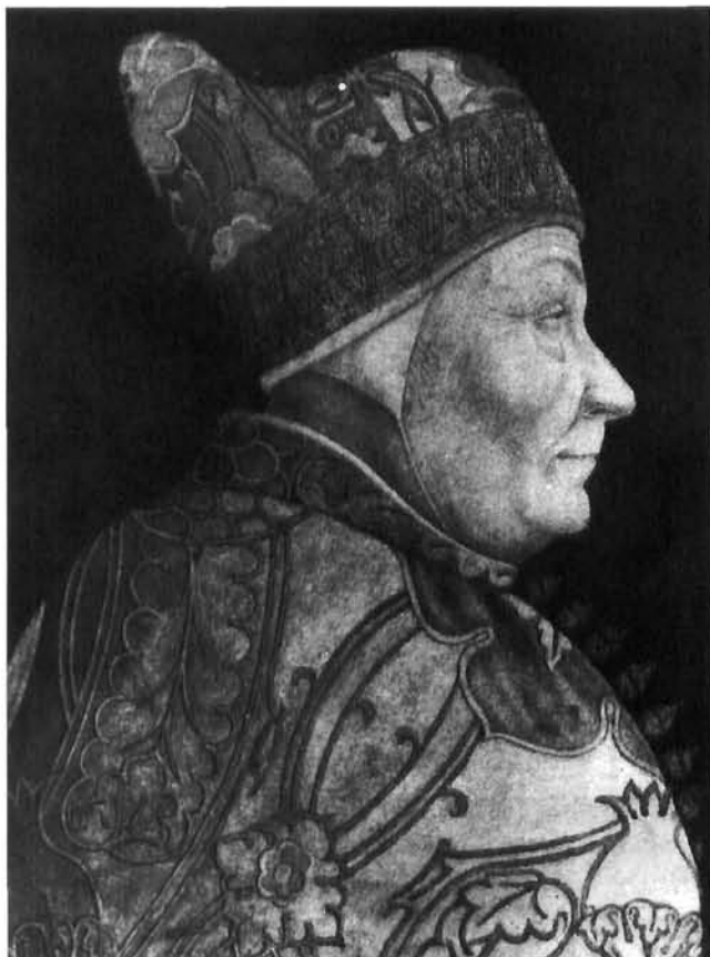
Lazzaro Bastiani, Dužd Francesco Foscari. Museo Correr, Venecija Lazzaro Bastiani, Doge Francesco Foscari. Museo Correr, Venice

Četvrta glava jajolikog oblika prikazuje muškarca mlađih godina, nategnute kože lica, oblih obrva ispod kojih se kriju pronicljive oči, pogleda usmjerenog prema prethodnoj. Glavu mu pokriva kapuljača koja seže do čela.