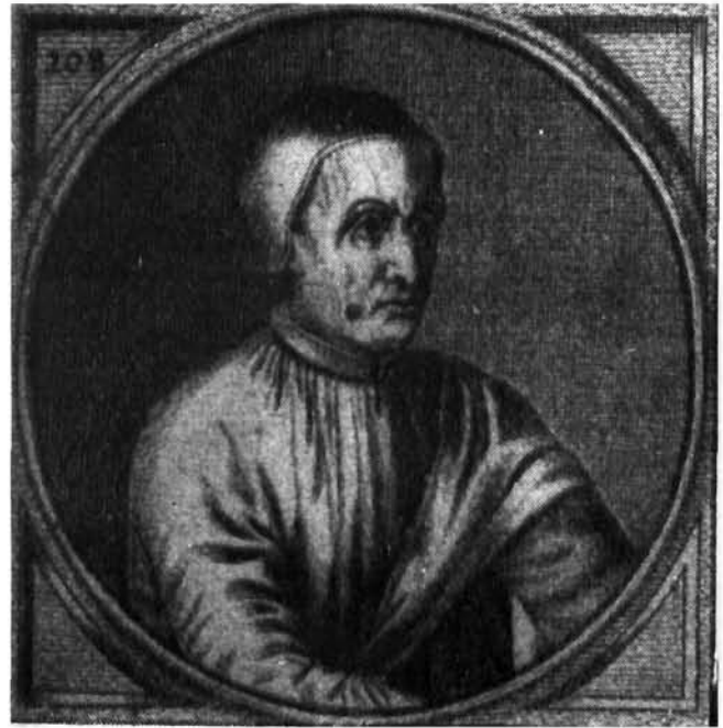
Portret Eugena IV, grafika Portrait of Eugen IV, graphic