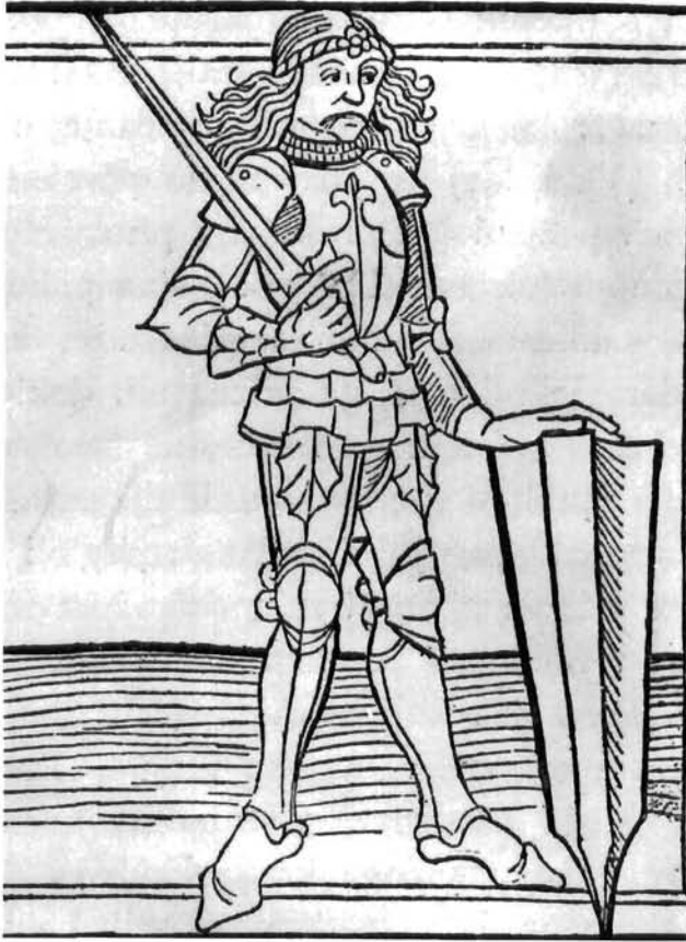
Portret Ivana Hunjadija, grafika Portrait of Ivan Hunjadi, graphic

da se isklešu te glave u kamenu i postave na katedrali. Taj svjetovni i nakazni trofej – završava narodna legenda – sam se raspada. 50