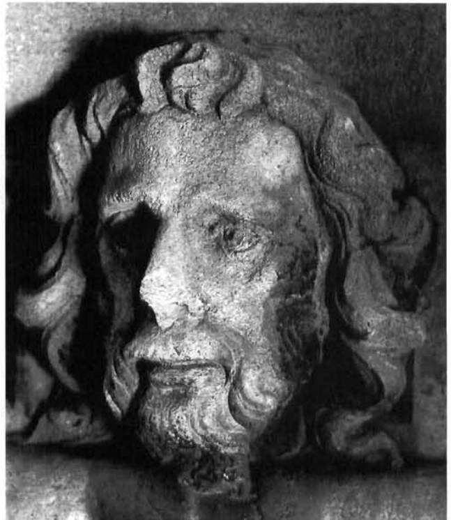
Juraj Dalmatinac, Ivan Hunjadi (?). Šibenik, katedrala Juraj Dalmatinac, Ivan Hunjadi. Šibenik cathedral

I među četrnaest glava smještenih desno od pilastra s posvetnim natpisom ispod reljefa Sv. Jerolima susrećemo niz markantnih fizionomija, koje su vrlo vjerojatno portreti. Postavlja se pitanje da li je svaka od sedamdeset glava portret, ili su neke od njih općeniti predstavnici čovječanstva? Što znače tri lavlje glave? Valja spomenuti da ljudske glave nalazimo kao ornament na dovratniku lavljeg portala.