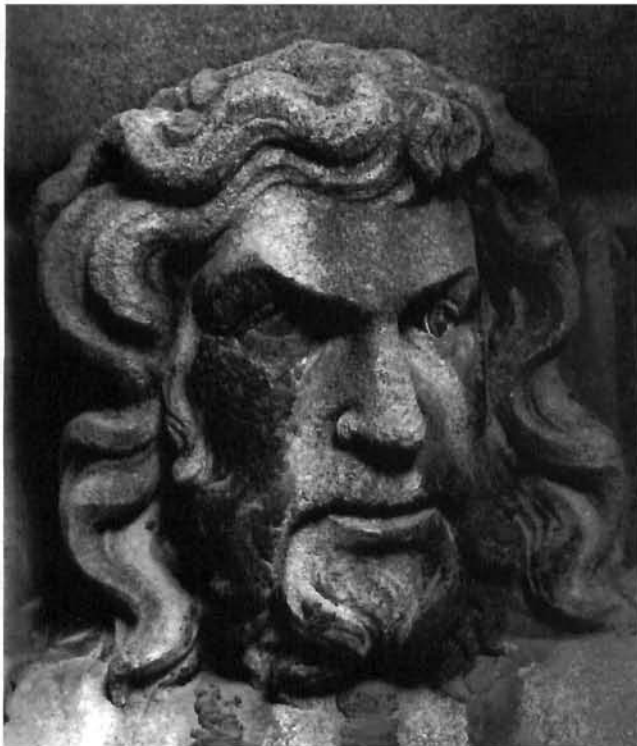
Juraj Dalmatinac, Vladislav II Jagelović (?). Šibenik, katedrala Juraj Dalmatinac, Vladislav II Jagelović. Šibenik, cathedral