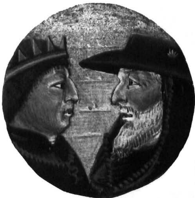
Kralj Ferdinand Aragonski i kardinal Bessarion, minijatura ( Adversus calumniatorem Platonis ). Bibliothèque Nationale, lat. 12946, c. 29r, Pariz King Ferdinand of Aragonia and Cardinal Bessarion, miniature from the Adversus calumniatorem Platonis. Bibliothèque Nationale, lat. 12946, c. 29 r, Paris