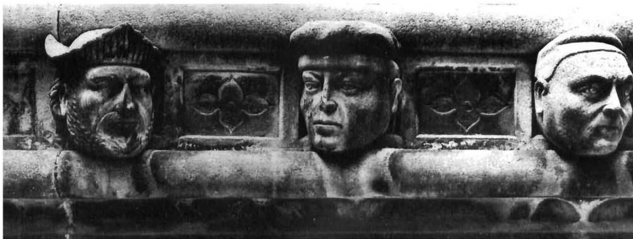
Juraj Dalmatinac, Ivan VIII Paleolog, Sigismund Malatesta (?) i dužd Foscari (?). Šibenik, katedrala Juraj Dalmatinac, Ivan VIII Paleolog, Sigismund Malatesta and doge Foscari. Šibenik cathedral

pokazuje niz sličnosti s tim portretima, pa se može pretpostaviti da upravo ona prikazuje portret pape.