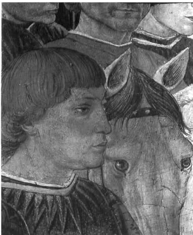
Benozzo Gozzoli, Sigismund Malatesta ili Gian Galeazzo Sforza (?), freska, palača Medici-Riccardi, Firenza