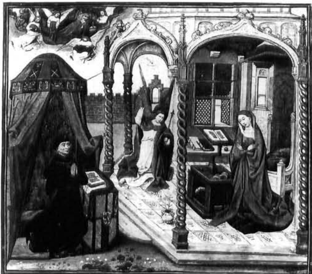
Navještenje i donator Filip Dobri, minijatura. Nacionalna biblioteka (Ms 9270, f. 2v), Bruxelles

Annunciation and donator Filip Dobri (Philip the Good), miniature. National Library (Ms 9270, f. 2v), Bruxelles