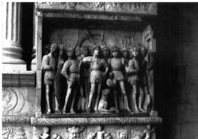
Alfonso Aragonski s pratnjom, slavoluk u Castelu Nuovo, Napulj Alfonso Aragonski with his suite, triumphal arch in Castel Nuovo, Naples