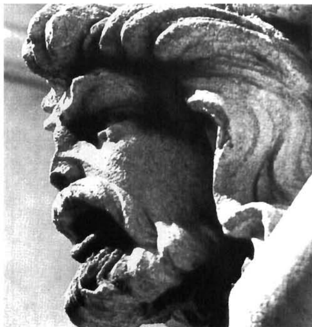
Juraj Dalmatinac, Kardinal Bessarion (?). Šibenik, katedrala Juraj Dalmatinac, Cardinal Bessarion. Šibenik cathedral

novcu i na pečatima problematični i uglavnom shematizirani, bez raspoznatljivih individualnih crta lica, teško je uzeti te prikaze kao precizne dokaze. Stoga sam, bez obzira na stanovitu mogućnost da je riječ upravo o Đurđu Brankoviću, mišljenja da pitanje identifikacije te glave treba ostaviti otvorenim.