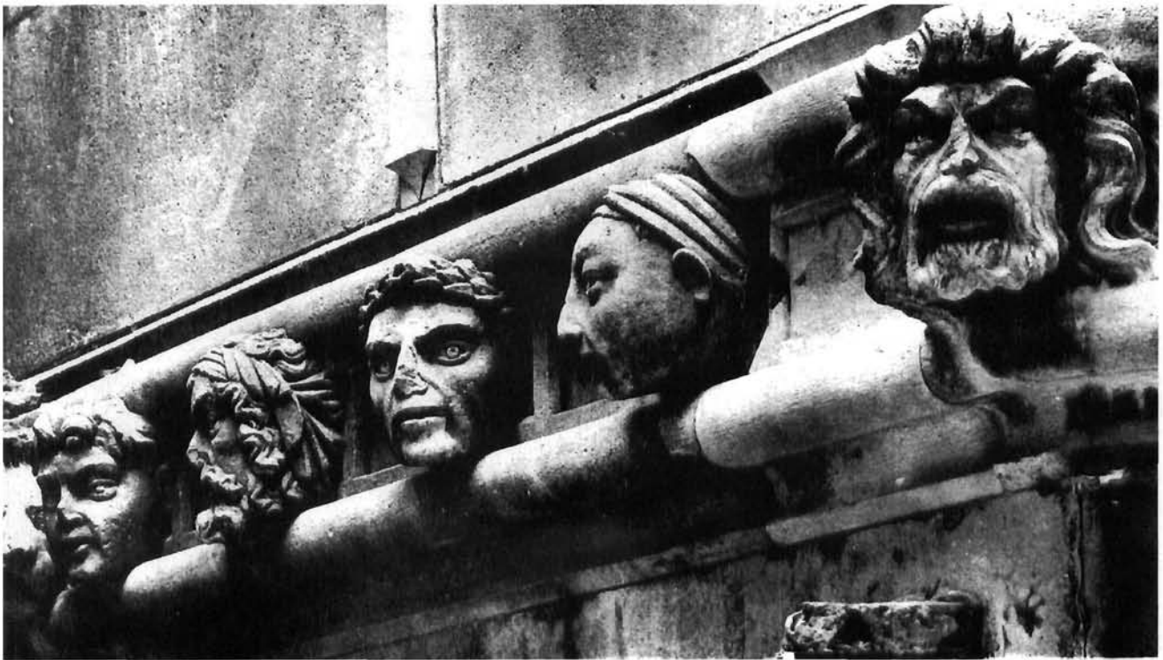
Juraj Dalmatinac, Detalj glava na početku druge apside. Šibenik, katedrala Juraj Dalmatinac, detail of the heads, first part of the second apse, Šibenik cathedral

Giacoma Pasinija, spomenutog kipara koji je u XIX. st. radio na izmjeni i restauraciji Jurjevih glava. Za glavu žene izrazito pravilna ovalna lica – šesnaestu na drugoj apside – mislilo se da prikazuje Danteovu Beatrice. U četvrtoljavi na trećoj apside, za koju se pretpostavljalo da je portret Maksimilijana, brata cara Franje Josipa I, prepoznaje Škarica lik orguljaša Tedeschinija, a u tridesetoljavi fizionomiju suca Jakova Nikolinića. 25