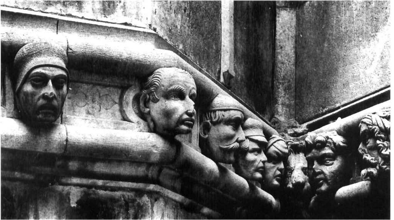
Juraj Dalmatinac, Glave na kraju prve i početku druge apside, Šibenik, katedrala Juraj Dalmatinac, heads at the end of the first and first part of the second apse