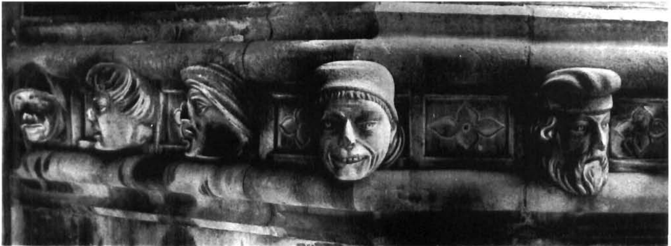
Juraj Dalmatinac, Detalj glava prve apside. Šibenik, katedrala Juraj Dalmatinac, detail of the heads on the first apse of the Šibenik cathedral

toričari, iz čijih tekstova sam pokušala ukratko iznijeti glavne podatke.