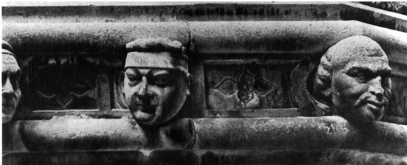
Juraj Dalmatinac, Francesco Sforza (?) i nepoznati vladar. Šibenik, katedrala Juraj Dalmatinac, Francesco Sforza and an unknown ruler. Šibenik cathedral