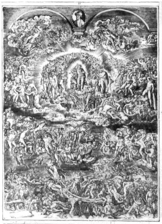
I. stanje, ante litteram , Istituto Nazionale per la Stampa, Rim Stage I, ante litteram, Istituto Nazionale per la Stampa, Rome