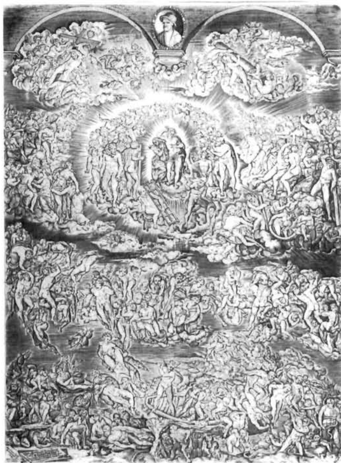
II. stanje, s posvetom i podatkom o Rotinu autorstvu, Istituto Nazionale per la Stampa, Rim Stage II, with dedication and a note of Rota's authorship, Istituto Nazionale per la Stampa, Rome

maju dekorativnim dodacima i popratnim tekstom, poput autora lista što ga u Rimu nakon 1570. izdaju nasljednici Antonija Lafreryja. Kao što je dekorativni okvir s natpisom na grafičkom prikazu Sv. Ivana, čiji se autor Cherubino Alberti, od jednog lika izvađenoga iz velike freske načinio pobožnu sliku, tako u postupku »uokviravanja« i tekstualnog dopunjavanja cjeline djeluje ista tendencija: ona koja Michelangelovu fresku pretvara u simboličku metaforu kršćanske dogme, a njezina je srž u poruci upisanoj na donjoj margini lista izdanog kod Nicolaa Nellija Fuor de' l' oscure tombe Doue hor giacete poca polue, et ossa, Ogni forma mortal da uoi rimossa, Humani corpi, uscite. Li horrido suon de le celesti trombe, Che ui chiamano, udite. Et 'l Re del ciel ne l' aureo tron mirate Dir a questi Venite, a quelli Andate.