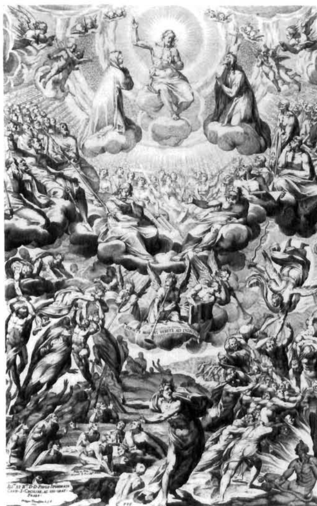
Francesco Villamena, Posljednji sud, 1603, bakrorez, 520×330 mm, Albertina, Beč

Francesco Villamena, The Last Judgement , 1603, engraving, 520×330 mms. Albertina, Vienna