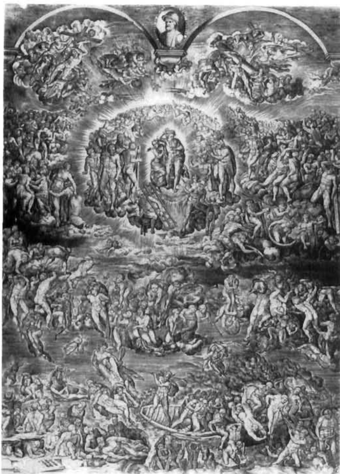
Jan Wierix, Posljednji sud, prema Michelangelu (Roti), poč. 17. st., bakrorez 312×222 mm, Graphische Sammlung des Kunsthistorischen Instituts, Tübingen

Jan Wierix, The Last Judgement , after Michelangelo (Rota), beginning of the 17th century, engraving, 312×222 mms. Print Collection, Kunsthistorisches Institut, Tübingen