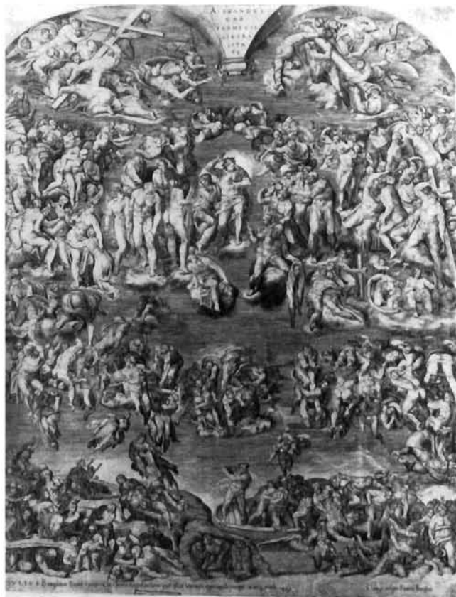
Giulio Bonasone, Posljednji sud, prema Michelangelu, oko 1545, bakrorez, 578×446 mm. Istituto Nazionale per la Stampa, Rim Giulio Bonasone, The Last Judgement , after Michelangelo, ca. 1545, engraving, 578×446 mms. Istituto Nazionale per la Stampa, Rome

Za djelovanje cjeline Michelangelove kompozicije izmjena proporcija formata još je važnija od promjena pojedinosti. Format Rotinog bakroreza najmanji je od svih grafičkih reprodukcija na jednom listu, a proporcije su izmijenjene u korist uspravnog kadra. Izduljeno proporcioniranje imalo je za posljednju zgušnjavanje figura po vertikali i zbijanje skupina. Istodobno figure su blago istanjene, a njihovim pomicanjem i preklapanjima, – primjerice figure uskrslih koje se uspinju prema nebesima – promijenjena je tektonika kompozicijske cjeline. I dvojica središnjih anđela – trubača na Rotinom listu međusobno su približena tako da im se obodi otvora trubalja gotovo dotiču, a cijela skupina stisnuta je i pomaknuta ulijevo, zbog čega dolazi do niza presijecanja i preklapanja kojih nema na freski. Pomaknuta je i lada s veslačem Haronom, koji je dospio iznad spilje i tako, što je veoma važno, proširio zonu koja pripada paklu. 4 Te kompozicijske »poremećaje«, koji proizlaze iz drugačije koncepcije prijevoda, ne nalazimo ni na jednom ranijem bakrorezu. Zbog njih, i drugih značajki, Rotin list predstavlja prekretnicu u grafičkom prevodenju Michelangelove freske.