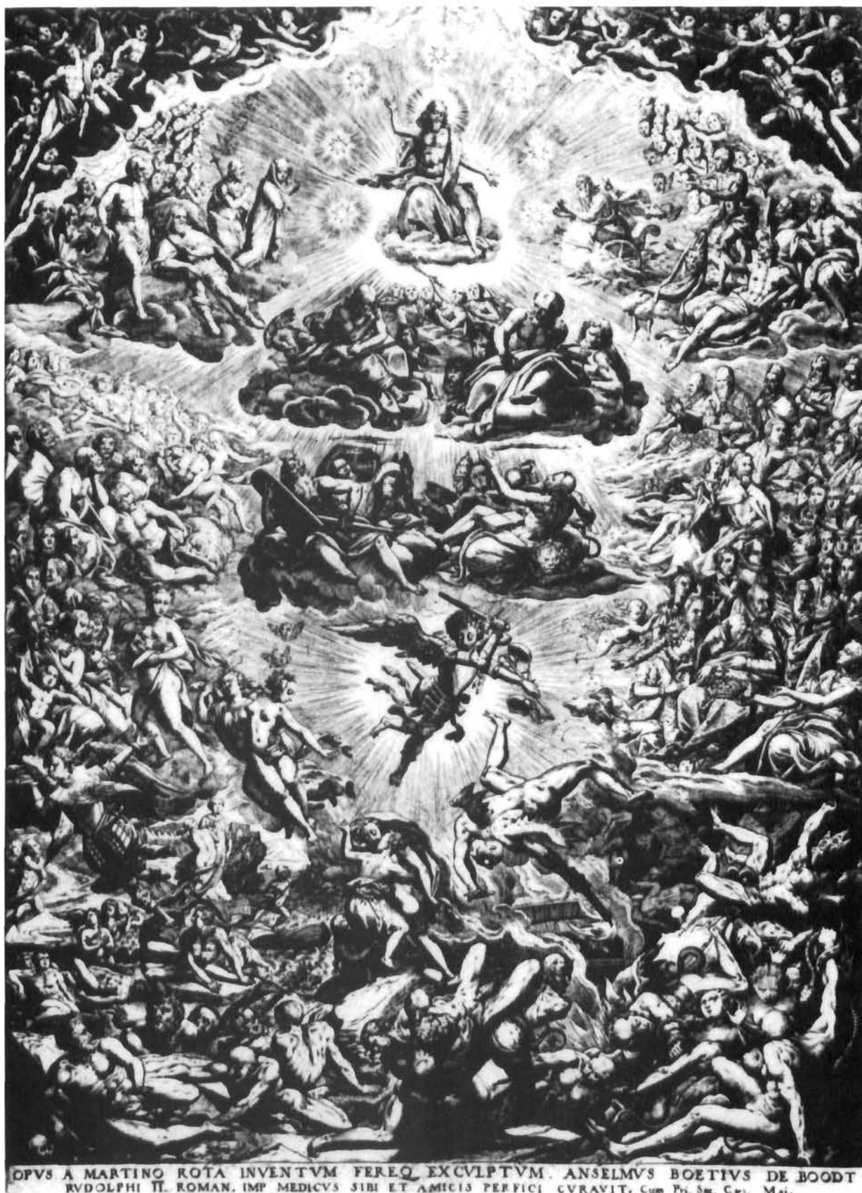
Martin Rota-Kolunić, Posljednji sud, 1576, bakrorez 311×231 mm, Albertina, Beč Martin Rota-Kolunić, The Last Judgement , 1576, engraving, 311×231 mms. Albertina, Vienna