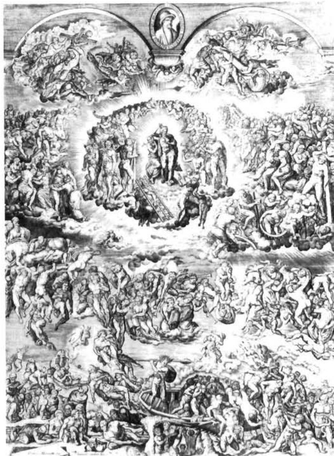
Leonard Gaultier, Posljednji sud, prema Michelangelu (Rota), kraj 16., poč. 17. st., bakrorez 312×232 mm. Istituto Nazionale per la Stampa, Rim Leonard Gaultier, The Last Judgement, after Michelangelo (Rota), end of 16th/beginning of 17th century, engraving, 312×232 mms. Istituto Nazionale per la Stampa, Rome

su ga nakon njegove smrti (1566.) Girolamo da Fano, Domenico Carnevali i Cesare Nebbia (1586.). Oblačenje je »dovršio« Stefano Pozzi za pape Klementa XIII. (1758-1769)