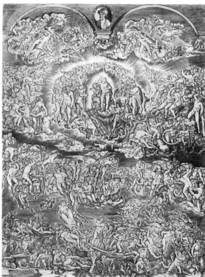
Matthias Greuter, Posljednji sud, prema Michelangelu (Roti), poč. 17. st., bakrorez, 311×229 mm. III. stanje, s izbrisanim podacima o Rotinu autorstvu i godini nastanka izvornika, Raccolta Bartarelli, Milano

Jan Wierix, The Last Judgement , after Michelangelo (Rota), beginning of the 17th century, engraving, 312×222 mms. Print Collection, Kunsthistorisches Institut, Tübingen