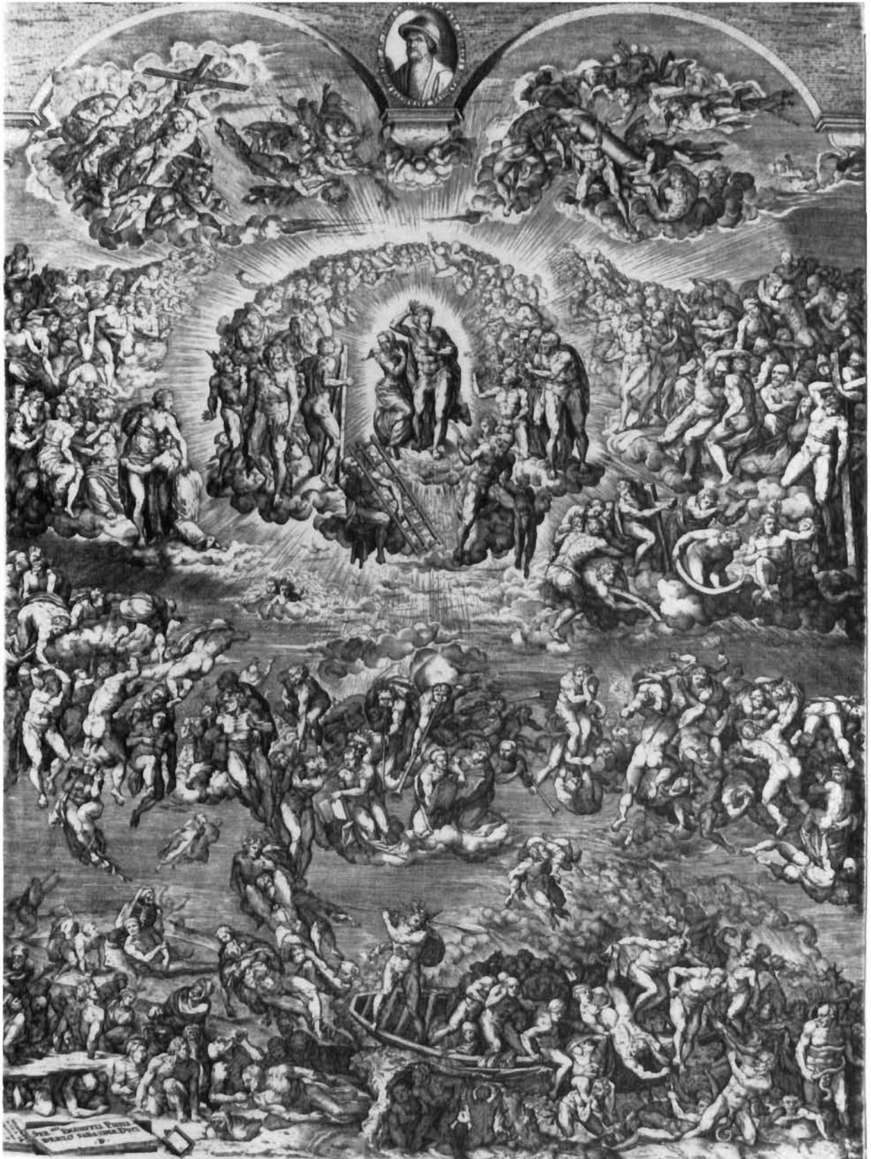
Martin Rota-Kolunić, Posljednji sud, prema Michelangelu, 1569, bakrorez 318×234 mm. Landesmuseum Joanneum, Kupferstichkabinett, Graz (II. stanje) Martin Rota-Kolunić, The Last Judgment , after Michelangelo, 1569, engraving, 318×234 mms, Landesmuseum Joanneum, Print Collection, Graz (stage II)