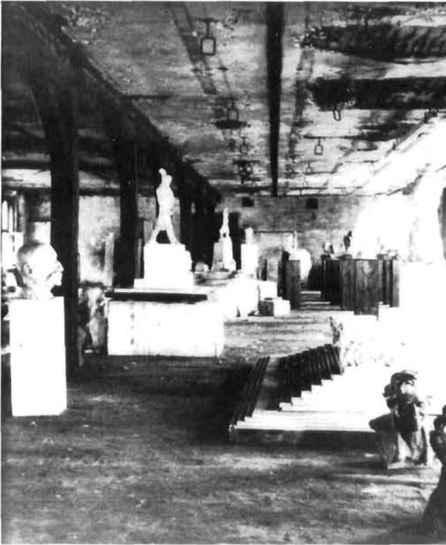
Gipsoteka HAZU: moderna hrvatska skulptura u II. katu ulične zgrade 1942. godine Plaster Cast Collection HAZU: modern Croatian sculpture on the 2nd floor of the street building in 1942