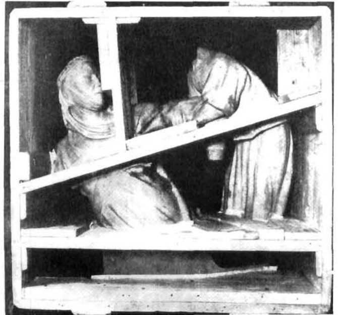
Ilustracija iz knjige »La protection des monuments et oeuvres d'art en temps de guerre«, Paris, 1939; upute za zaštitu i evakuaciju umjetničkih djela Illustration from the book »La protection des monuments et oeuvres d'art en temps de guerre«, Paris, 1939: instructions for protection and evacuation of works of art