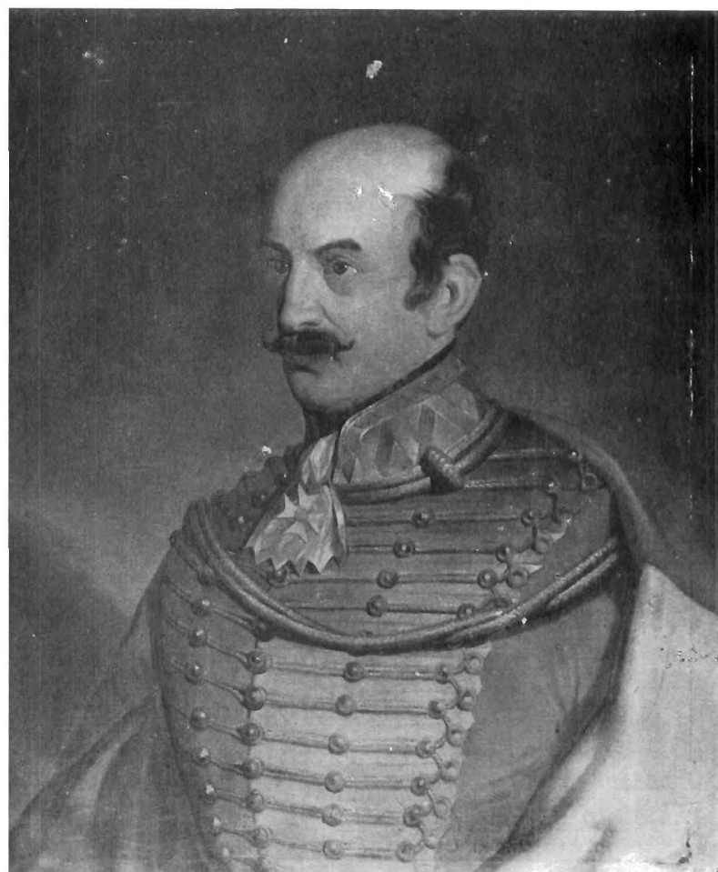
Nepoznati autor: Portret bana Jelačića, Galerija likovnih umjetnosti, Osijek

Unknown author: Portrait of Ban Šokčević, Gallery of Fine Arts, Osijek