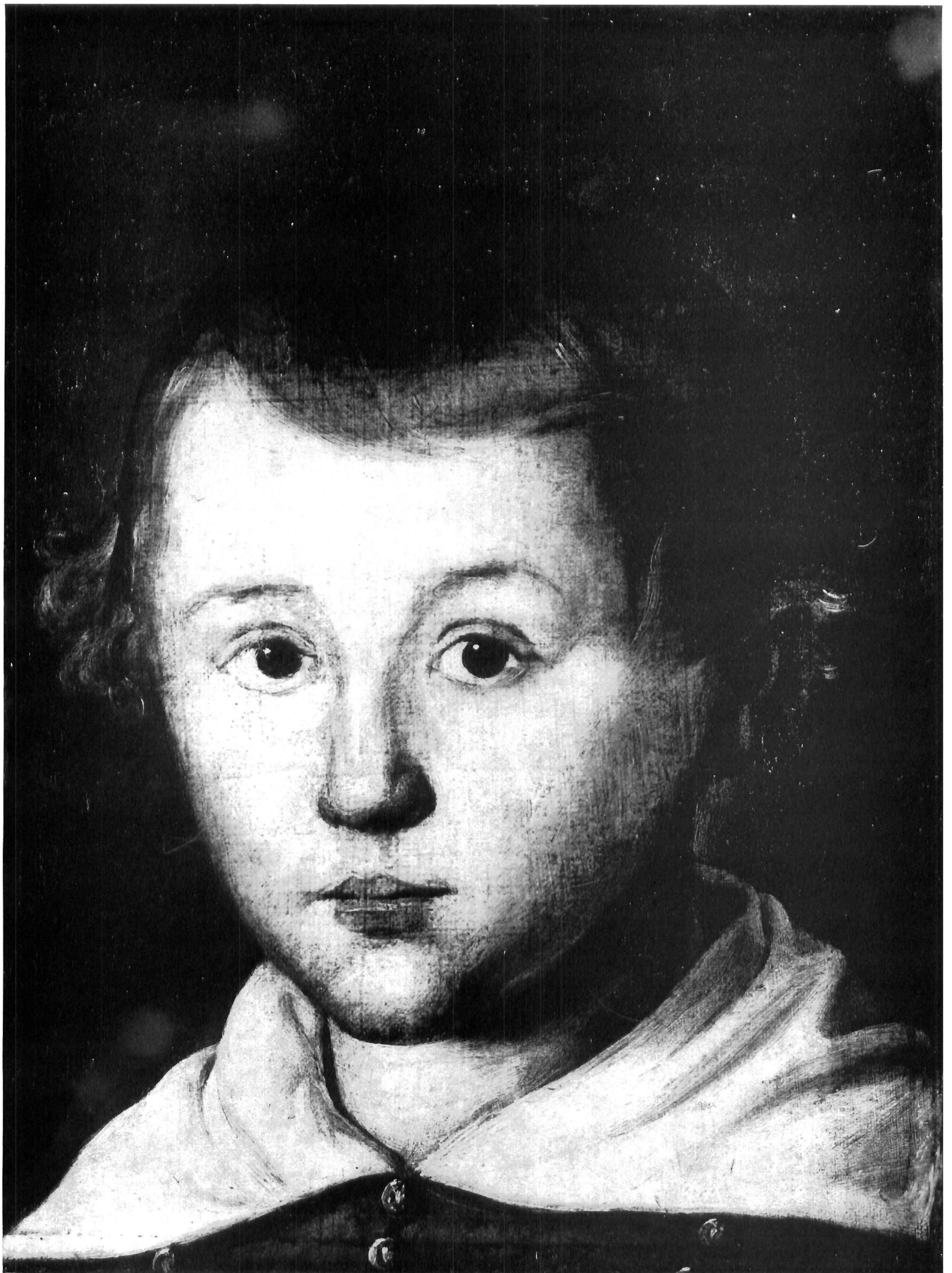
Franjo Pfalz: Dječja glava, Galerija likovnih umjetnosti, Osijek

Franjo Pfalz: Child's head, Gallery of Fine Arts, Osijek