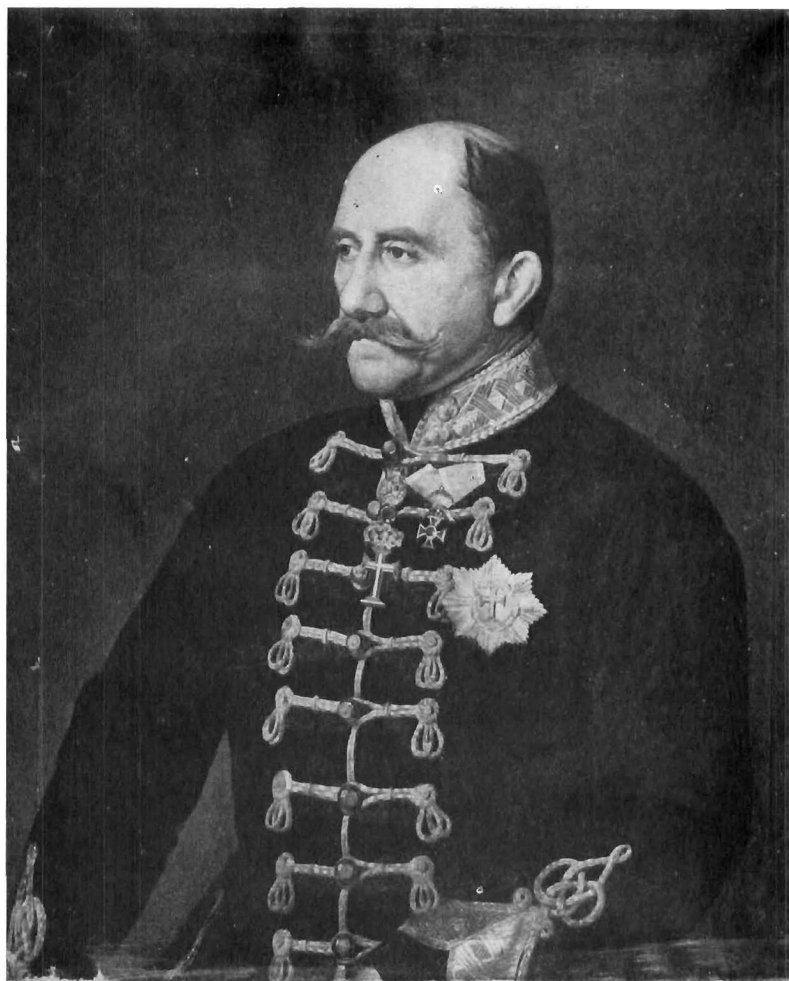
Nepoznati autor: Portret bana Šokčevića, Galerija likovnih umjetnosti, Osijek

Zatim je na nj negativno djelovala i vezanost za ikonografske kanone koje je trebalo poštivati. Oni su ograničavali slikarovu inventivnost koja je i inače, po svemu sudeći, bila slaba strana njegove imaginacije. Kao portretistu ležala mu je vezanost za objekt i bila mu je svojstvena deskriptivna i mjestimično penetrantna opservacija, a ovdje je iz imaginacije valjalo stvarati radnje, intenzivirati ih i slikarski realizirati.