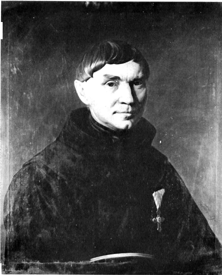
Franjo Pfalz: Portret fra Ernesta Benešića, Galerija likovnih umjetnosti, Osijek