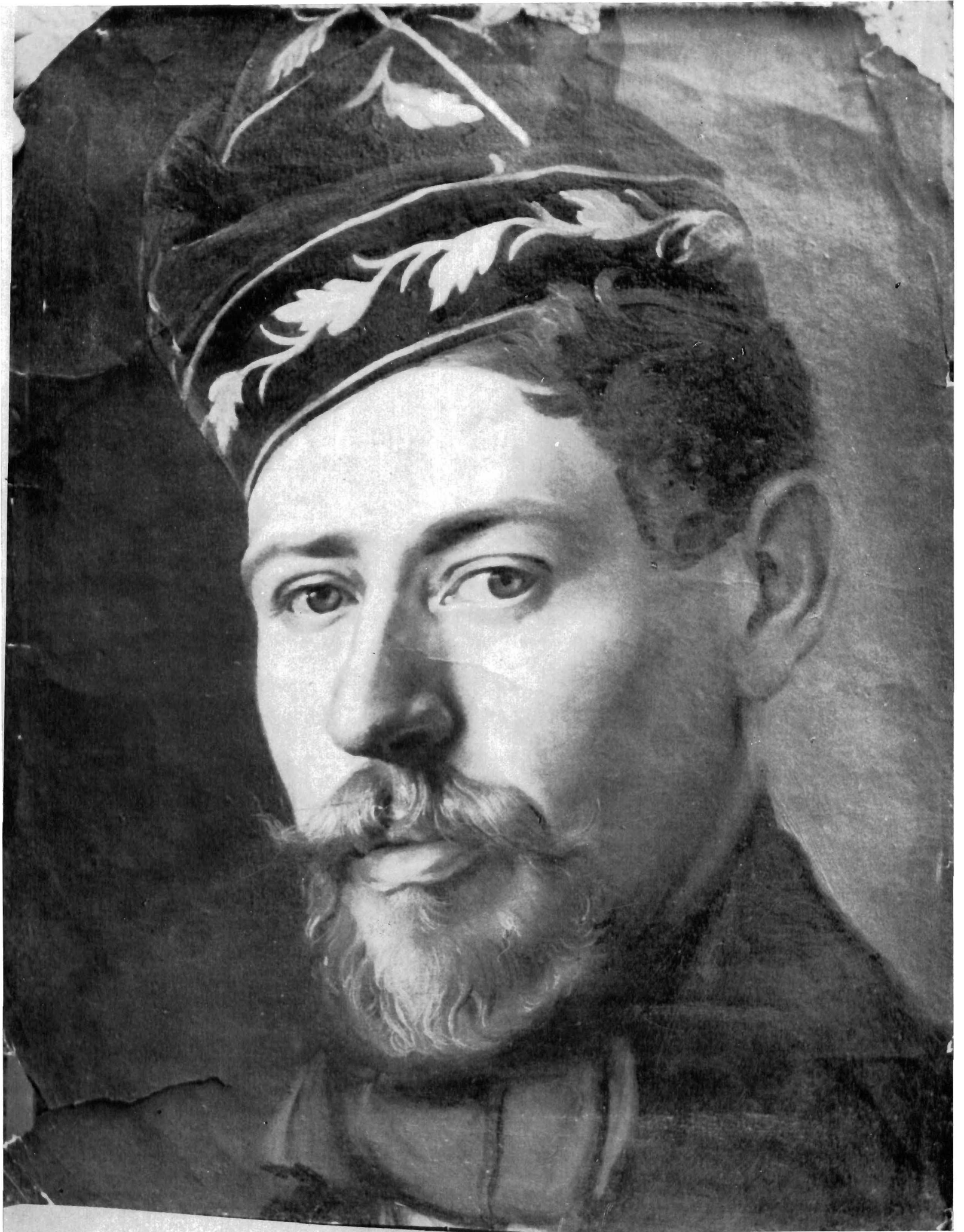
Franjo Pfalz: Autoportret, Galerija likovnih umjetnosti, Osijek