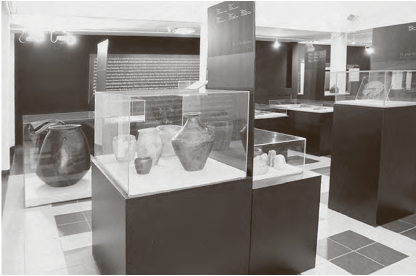
© S postava izložbe Foto Ž. Turk Joksimović

Katalog i izložba rezultat su rada skupine autora, kustosa Arheološkog muzeja u Zagrebu i Gradskog muzeja Sisak, koji su na položajima željeznodobnog i ranocarskog lokaliteta na području Siska zabilježili fascinantanu povijest jednog vremena. Izložbeni materijal odnosno sadržaj kataloga organiziran je u pet cjelina odnosno poglavlja: Segestika – naselje na Kupi, Rimaska vojska u Sisciji od Augusta do Klaudija, Od Segestike do Siscije, Predcarski novac iz Siska i Cezarski novac od Augusta do Klaudija.