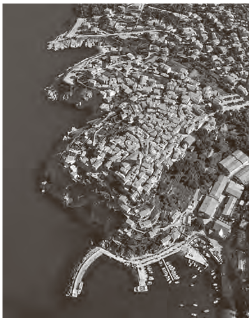
↑ Vrbnik iz zraka

Iščitavanjem cjeline dobiva se uvid u rezultate autorova predanog i opsežnog istraživanja za koje je prikupljena i znatna količina dokumenata, povijesnih fotografija, akvarela, mapa, veduta, arhitektonskih snimki. Radi lakšeg praćenja teksta, čemu pridonosi i jasan i razumljiv jezik koji autor koristi, priložene su i nove fotografije te planovi s označenim lokalitetima. Knjiga broji 240 stranica teksta popraćenih s preko pet stotina iscrpnih bilježaka. Na kraju knjige, uz sažetke na talijanskom, engleskom i njemačkom, pripremljen je popis izvora, literature te ilustracija kao i kazala te rječnik manje poznatih riječi.