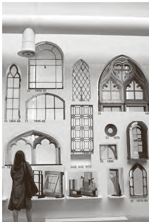
↑ Izložba “Elementi arhitekture”, tema prozora

nije ukazuje knjiga Giulie Foscari Elements of Venice (uz predgovor R. Koolhaasa), izašla pred samo otvaranje ovogodišnjeg Venecijanskog bijenala, koja dokazuje da je kroz mjerilo njegovih najsitnijih komponenti – arhitektonskih elemenata – itekako moguće prikazati čitav grad; odnosno kako bit ovog postupka slikovito tumači Adolf Loos u čuvenoj knjizi “Ornament i zločin” iz 1908. godine: “Kad od jednog izumrlog naroda ne bi ništa drugo ostalo već samo jedno jedino dugme, iz formi ovog dugmeta zaključio bih kako se odijevao i kakve je navike imao taj narod, kakve običaje, kakvu vjeru; znao bih njegovu umjetnost i duhovnu vrijednost.” 3 Promatrajući Loosovu misao iz današnje perspektive postaje vidljivo u kojoj se mjeri uloga elementa kao nositelja značenja