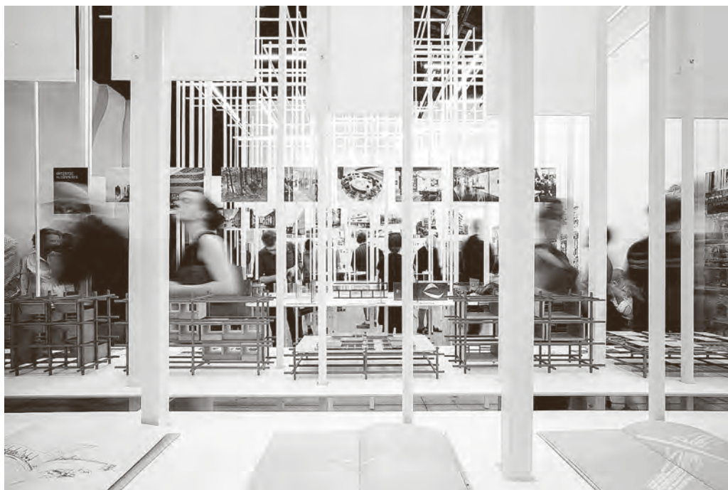
↑ Hrvatski paviljon "Podesnost apstrakcije"

naslovom Fitting Abstraction – podesnost apstrakcije – izdvojio arhitektonske vrijednosti koje predstavljaju temeljne 'principe gramatike' nacionalnog arhitektonskog jezika i nadilaze sferu konkretnih formi.