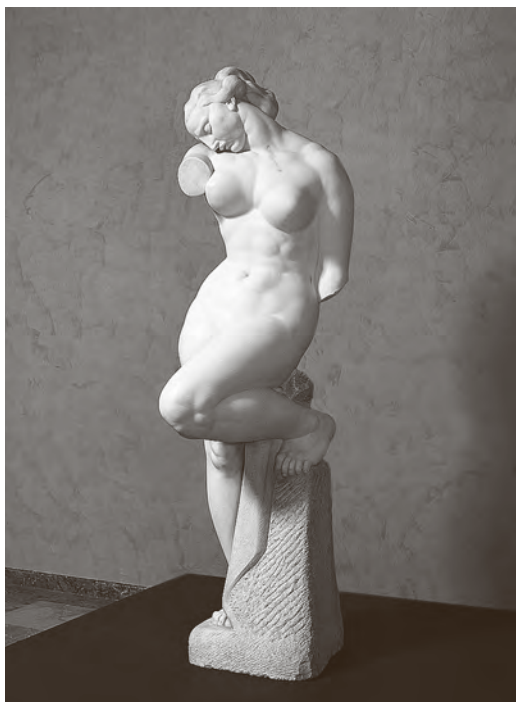
↑ Ivan Meštrović, Psiha Zagreb, 1927. carrarski mramor, 207 x 61,5 x 67 cm Galerija Meštrović, Split, GMS-2