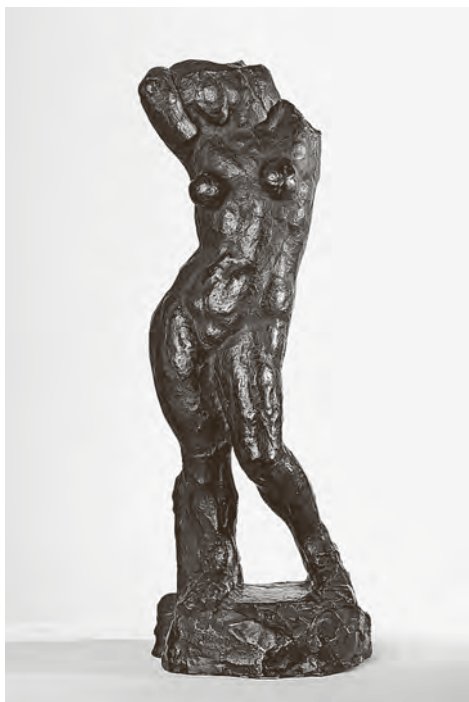
↑ Ivan Meštrović, Studija za Psihu Zagreb, 1926. –1927. bronca, 47 x 17 x 12 cm Atelijer Meštrović, Zagreb, AMZ-153