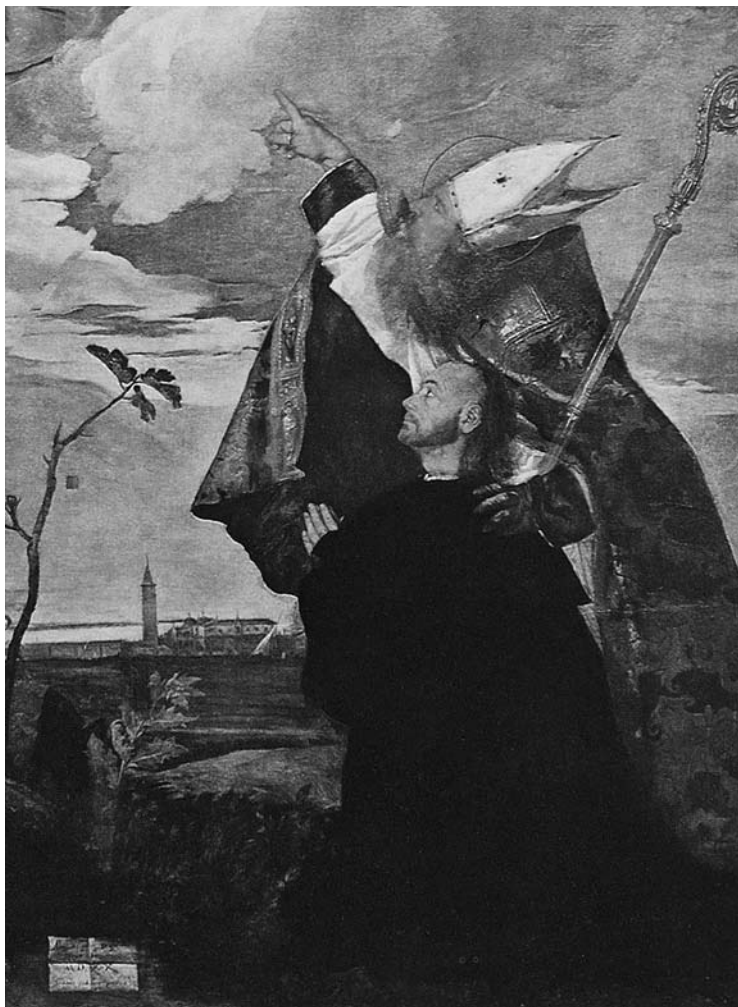
← Tiziano Vecellio, Pala Gučetić , detalj, 1520., Museo Civico, Ancona