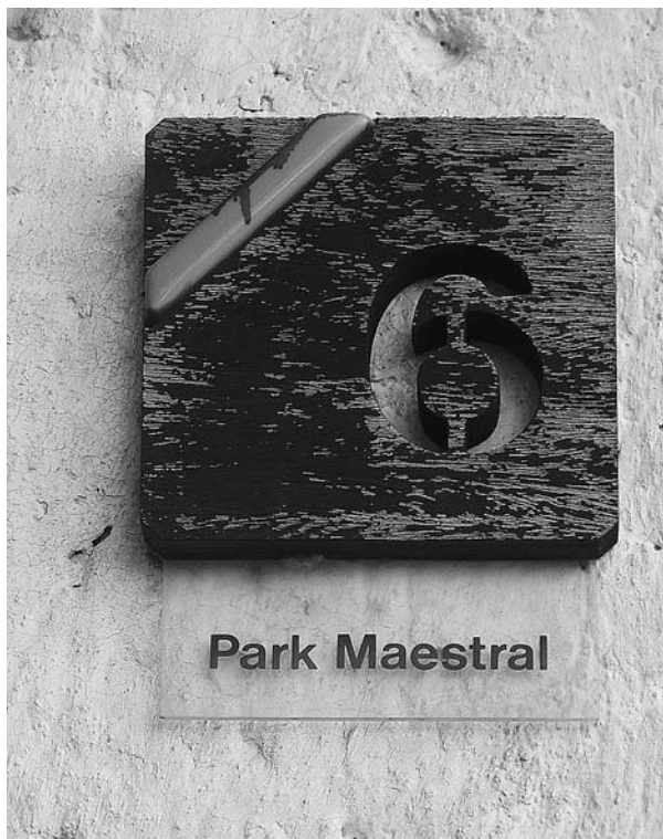
→ Červar-Porat, kućni broj, snimila: Ivana Haničar Buljan, 2008.

očuvanju prirodnih i kulturno-povijesnih vrijednosti uz izgrađene turističke objekte možemo istaknuti zapadnoistarsku regiju. 3 Primjer takvog modela, u kojem izvedba prati sustavno planiranje prostora, jest i projekt "sezonskoga grada" Červar-Porta pokraj Poreča. 4 Zamisao o izgradnji prvoga turističko-stambenog naselja na području općine Poreč potekla je od turističko-ugostiteljskog