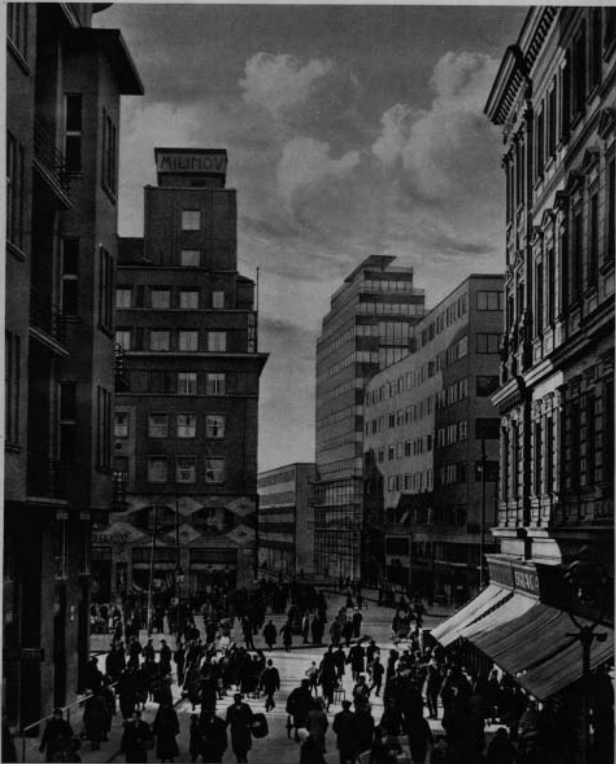
Is novoga Zagreba: Pogled s Dolca na nove zgrade u Gajevoj ulici; u pozadini na praznom gradilištu (ugao Bugarske ulice) neboder po zamisli prof. ark. Drago Iblera